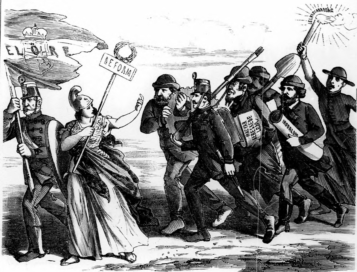
II. Ezek ki akarnak vivni valamit.

az utálatos bünfészekről, mely tönkre tesz engem, ha nem vagyok elég erős ellenállani a pokolnak, az ördögnek, és veszedelmes incselkedéseinek.