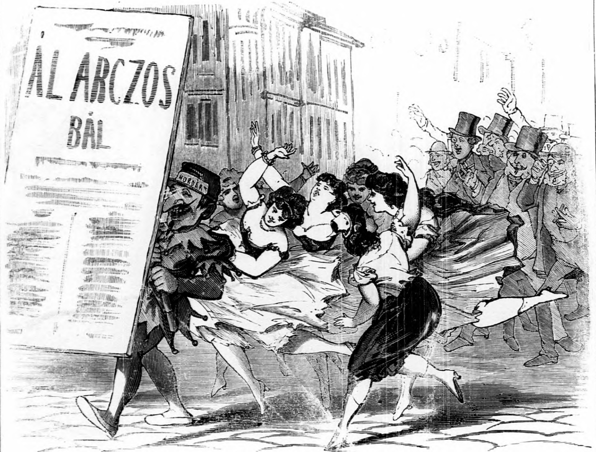
III. Ezek ki akarnak csalni valamit.