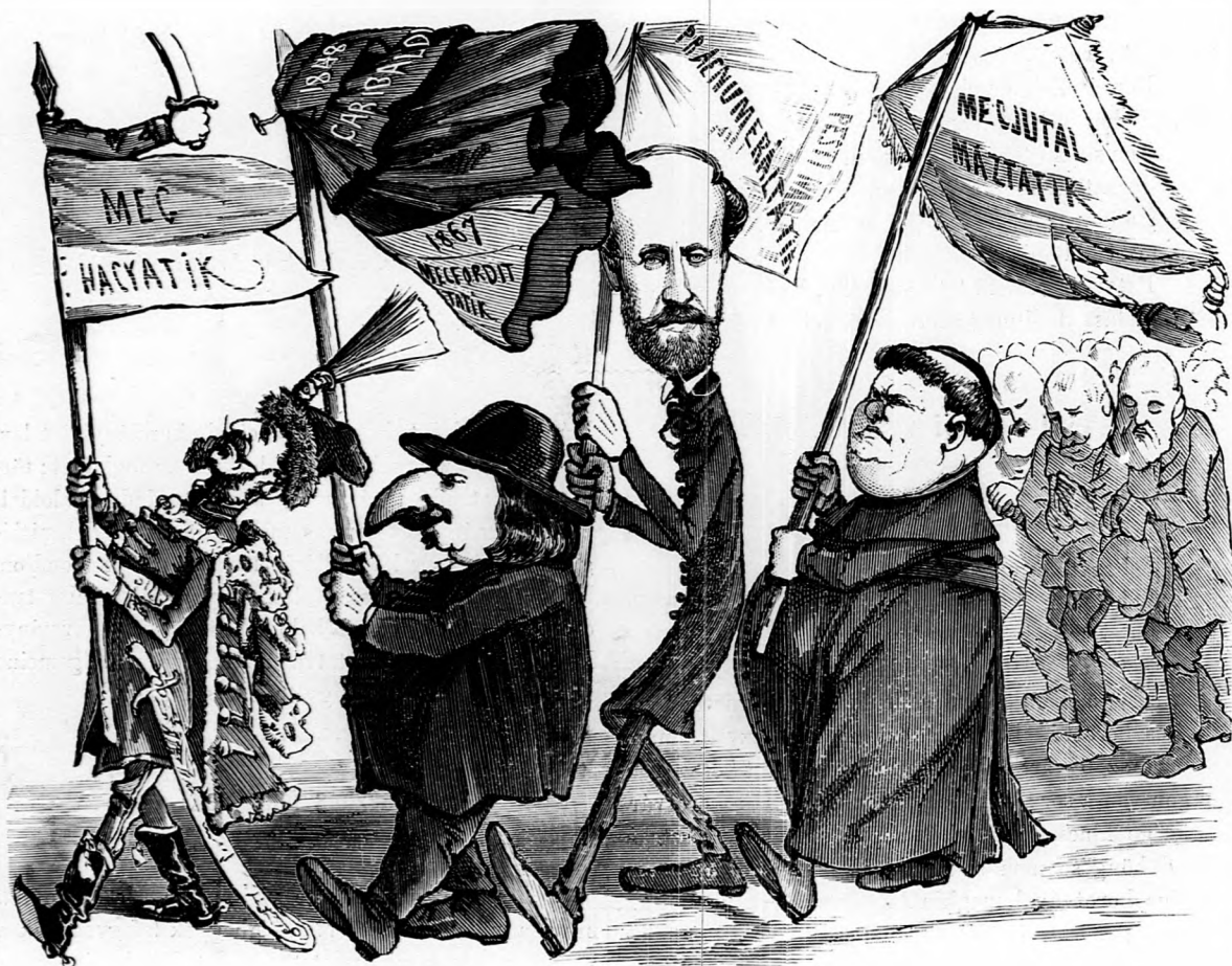
I. Ezek meg akarnak szolgálni valamit.