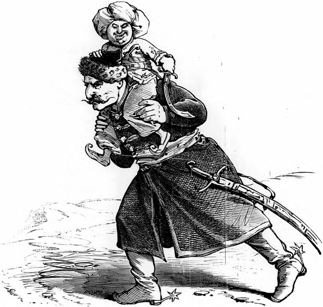
I. Mikor fiatal volt, nekünk kellett őt a nyakunkon hordanunk.

Ne izélj hát itt hiába, Eredj Bach után Rómába.