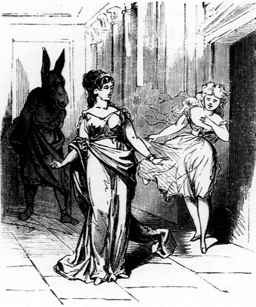
A nemzeti színházban meglehetősen neki vet- közve deklamálnak.