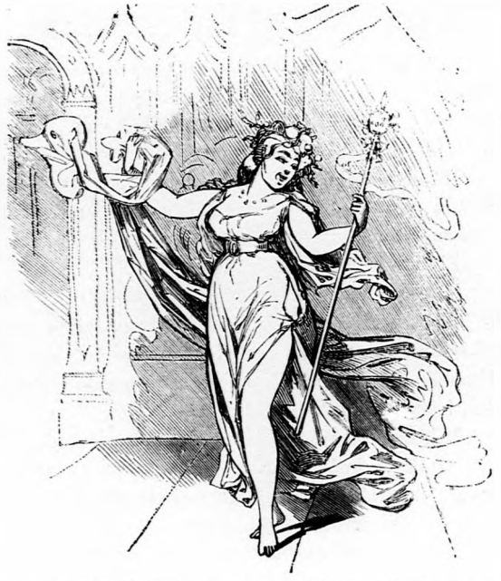
A népszínházban még jobban neki vetközve énekelnek.