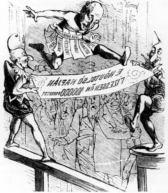
A börze színházban végre tökéletesen levetkőzve voltigiroznak

Félreverik Róma félezer harangját Pontifex maximus felemeli hangját. S a mint classikai nyelven dikciózók: Ciceró sirjában váltig forgolódik.