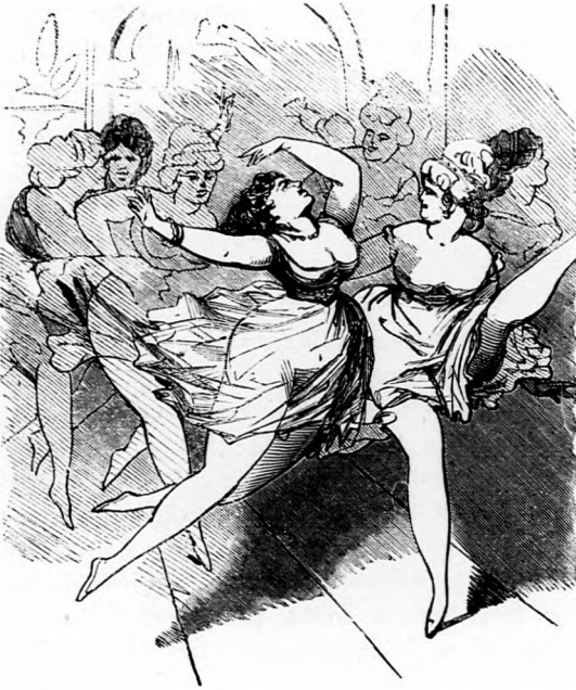
A német színházban de már ugyan neki vetkezve tánczolnak.