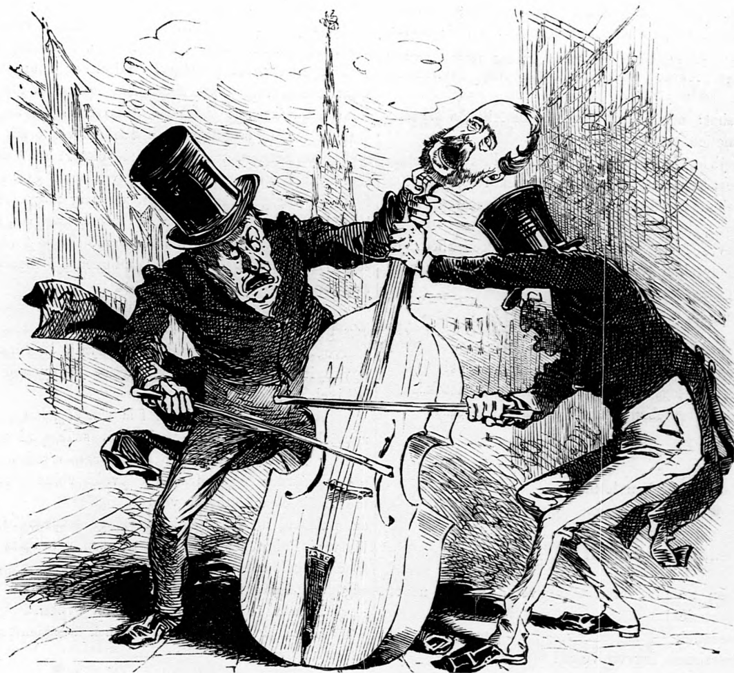
Bécsben Lónyait hegedűszóval fogadják, csakhogy ő rajta magán negedülnek.