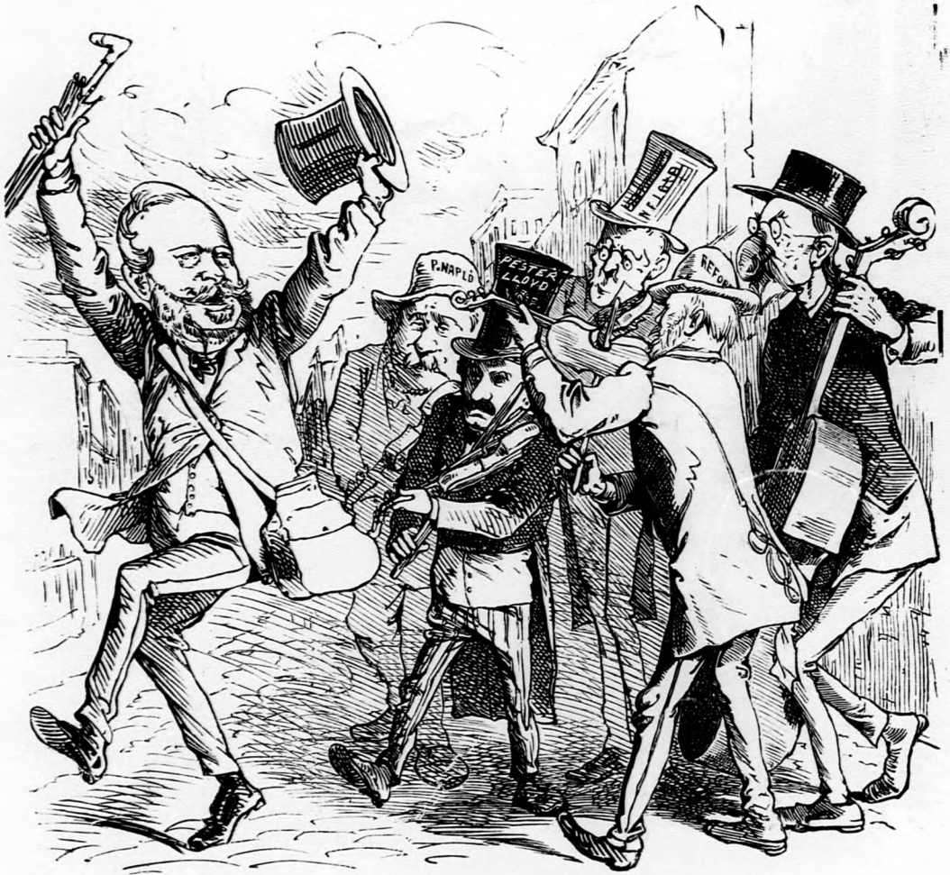
Lányait hegedűszóval kísérik ki Pestről.