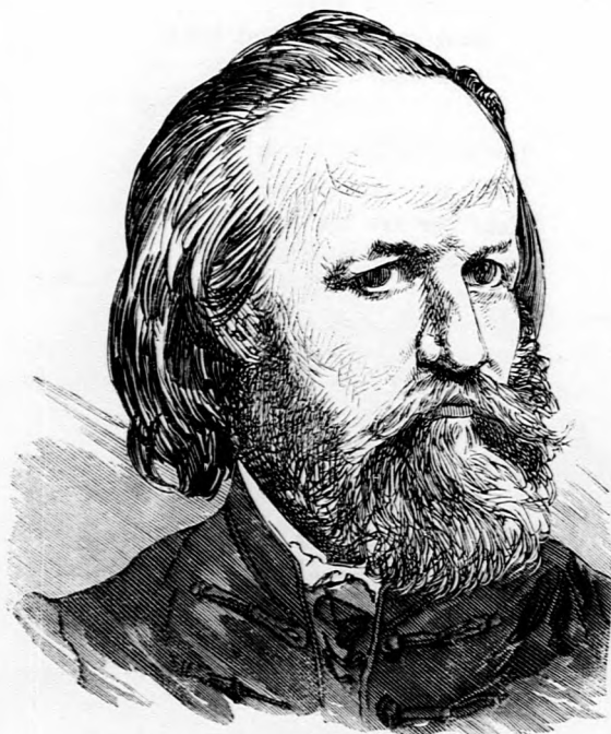
Vagy olyat, mint Pulszky?