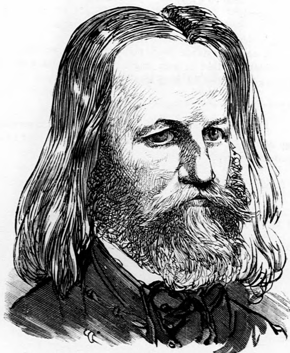
Vagy talán olyat, mint Murgu Eutin.