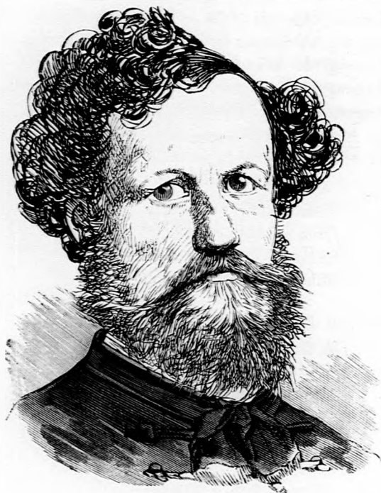
Olyat-e, mint gróf Andrássy?