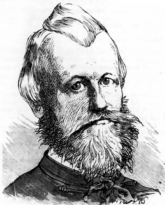
Vagy olyat, mint Rónay Jácint?,