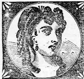
(Utánvétellel is küldetik.)

Papadour pasztám, mely csoda-pasztának is nevezetik, hatását soha sem fogja téveszteni; sikere e felülmulthatlan arez-pasztának minden várakozás-féltől: az egyetlen garantizott eszköz minden bőrkütség, pattanás szeplő májolt stb. gyors és bizonyos elmulasztására. A garancia annyira biztos, hogy ha nem hatna, a pénz vissza adathatik. Egy tégely e kitűnő pasztából utasítás-sal együtt 1 frt 50 kr. o. é.