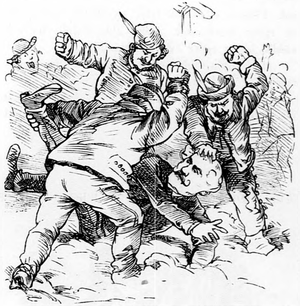
S amit Beszének osztogattak.