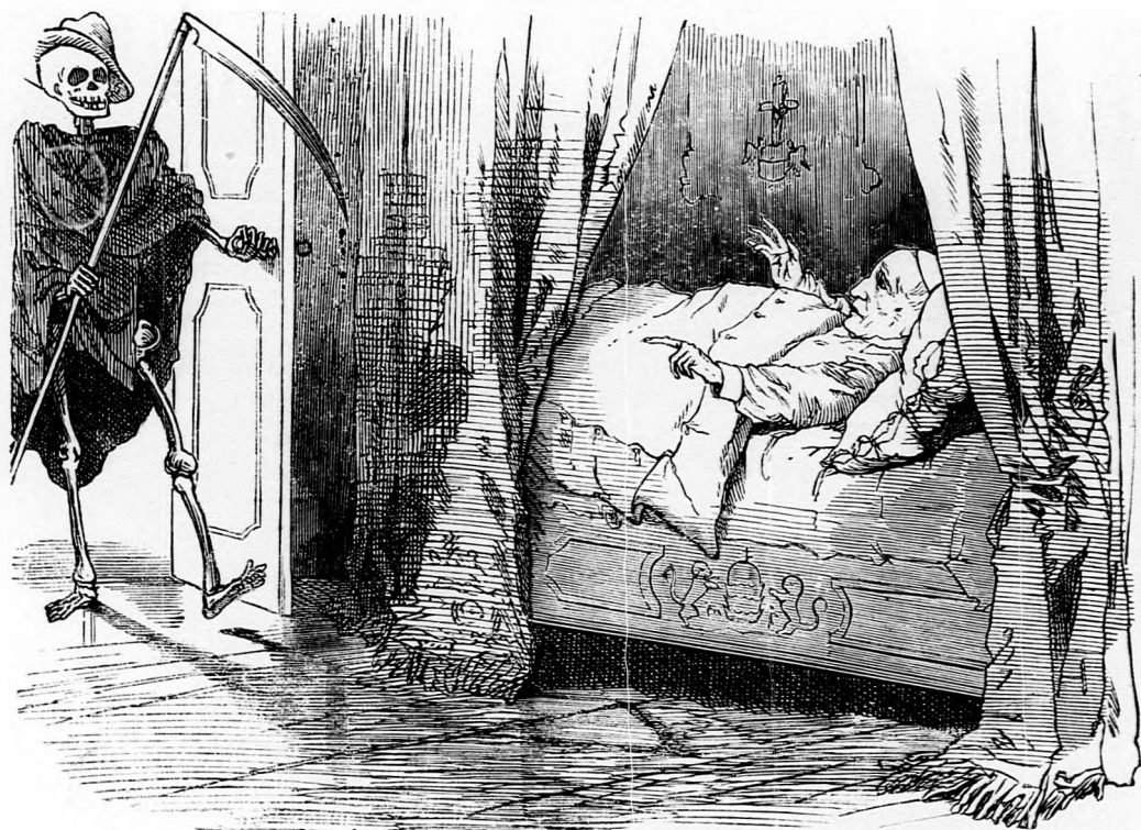
IX. Pius. Érzem közeledni az egyedül igazán csalhatatlant.