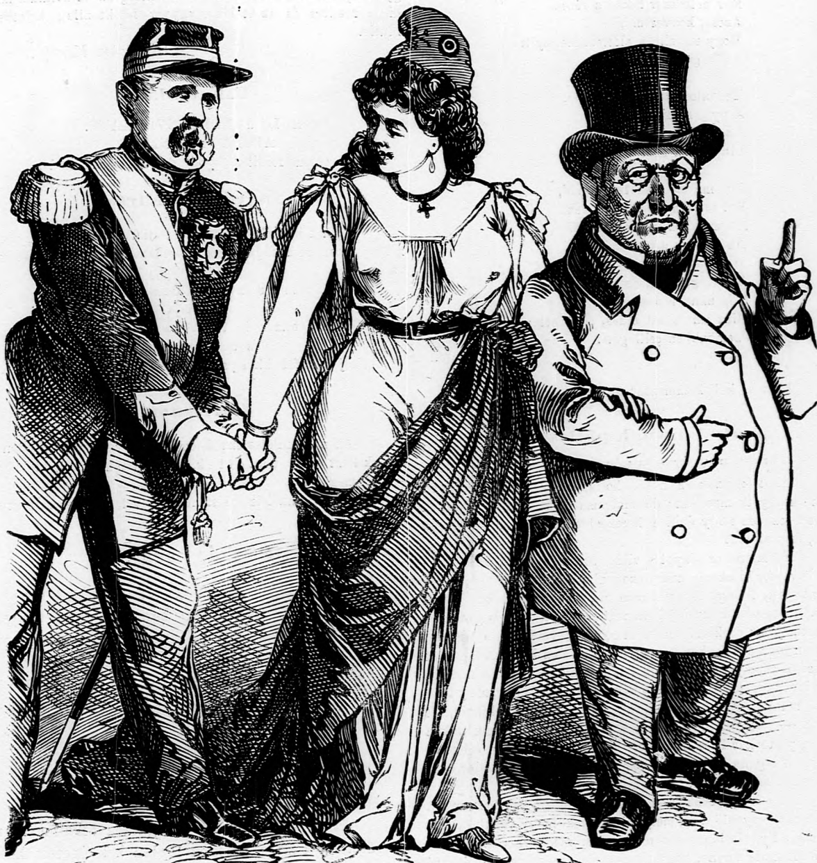
Thiers. — A menyecske már megint a katonák után jár.