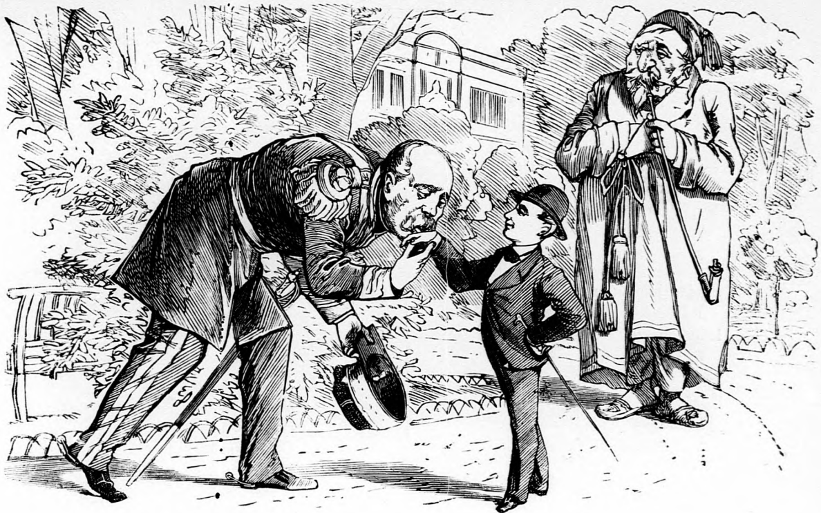
Chislehurstban Mac-Mahon csókolta a Lulu herceg kezét.