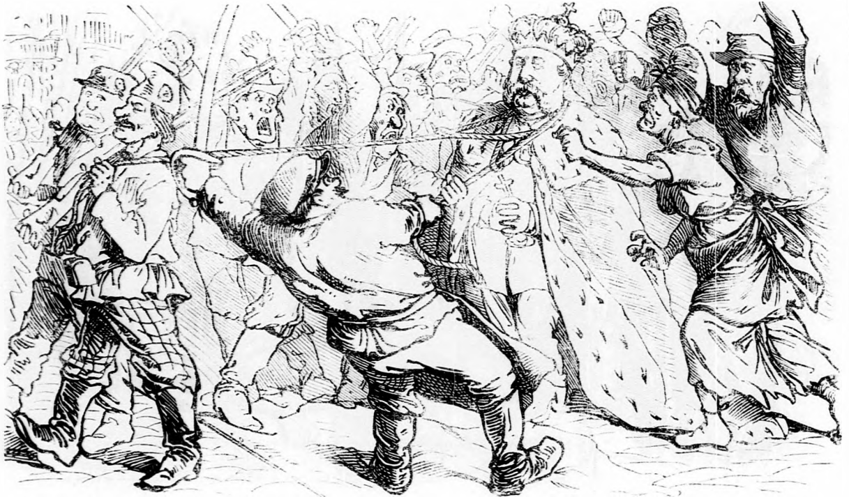
V. Henrik Párisba bevonul.