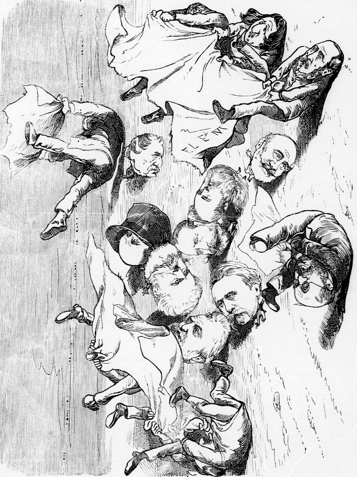
Tyhü, nem kellett volna ám olyan nagyon!