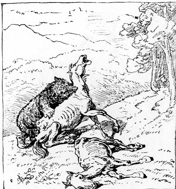
III. »Ni!« mond egy kan medve, a hogy látja eztet, »Kutya legyek, hogyha mindjárt meg nem eszlek.« S levágja a Szürkét, kapja Rárót nyakba Friss lóhúst a maczkó hamar bényakalja.