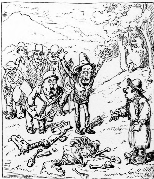
IV. Jön a végrehajtó, dobbal mint a század, Tyűn hisz nincs ezeken emberi ábrázat »Nincs ám«, mond a medve s mutatja az ornyát, »Árverezétek el adóba a csontját.«