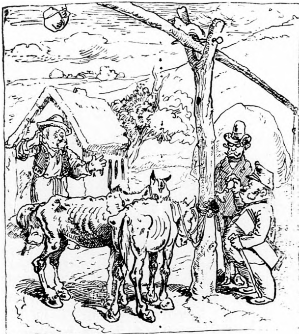
I. Történt pedig Gócsón, a minapi bócsón, Gergő gazda valajadóval adóson, Két szál végrehajtó hivatalos pecséttel Két lovát fékestől jágashoz pecsétel.