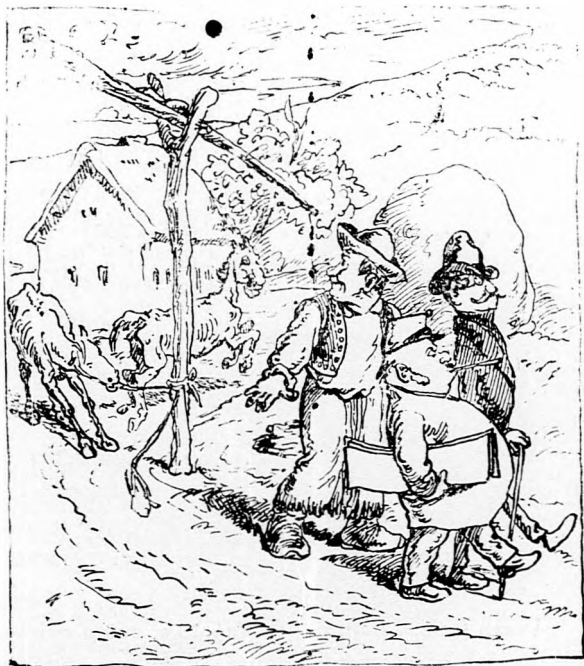
II. S mint a ki jól végzett, végrehajtó két szál, Gazdától követve hivatalba sétál. De hamis a két ló öszesúgnak vagy mi, S mennek ők is szökvést, zöld fűvet harapni.