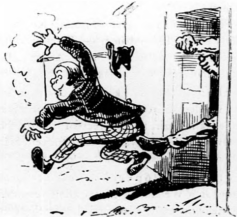
»Ott az ajtó, alló!« ugy kirepült rajta, Mint ha nem majom, de madár vón az apja.