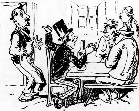
»Ugy biz, atyafiak, tiszta dolog nagyon Csapláros uramnak ősapja is majom.