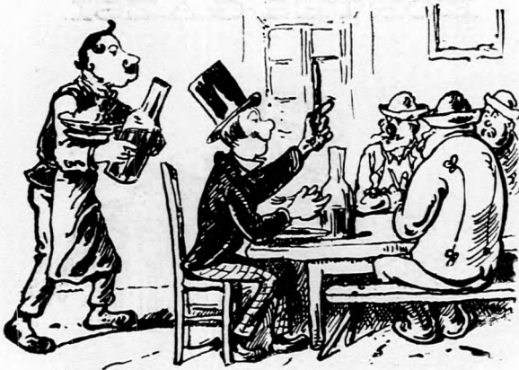
Kóspallag helységben szabó a csapszékben Természettudományt magyaráza éppen.