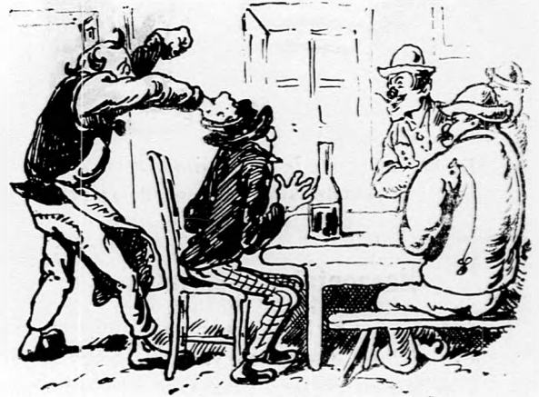
»Majom hát a tied, atta besté lelke.« Szabó legényt a fráz ugyan végig lelte.