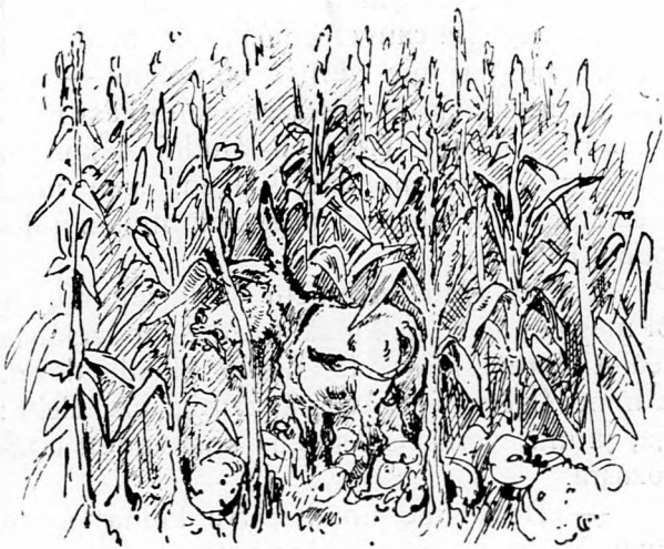
Nagy Kerekiben, a hol lakik Csánády, A falu »Pestája elmene sétálni.