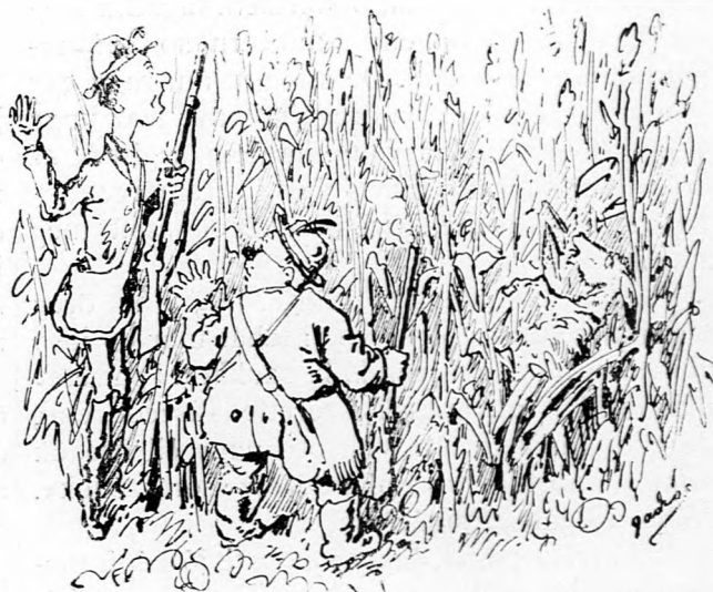
A Pesta felfordul, más jáger felkiált : »Az áldóját, bátyám, mi a manót csinált? Meglötte a Pestát!« — Hamar, vesd el magad! Gyilkos a doktorért a faluba szalad.