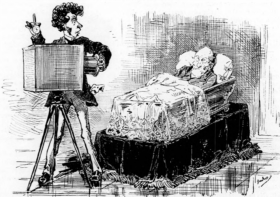
Fényképész. No most kinyitom a gépet. Kérem, ne tessék mozdulni.