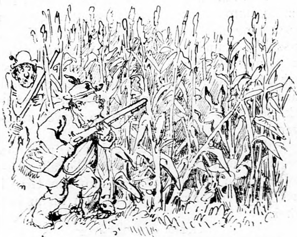
A jáger hallja, hogy kukuricza zörren,