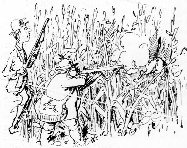
Felkapja puskáját, puska nagyot dörren.