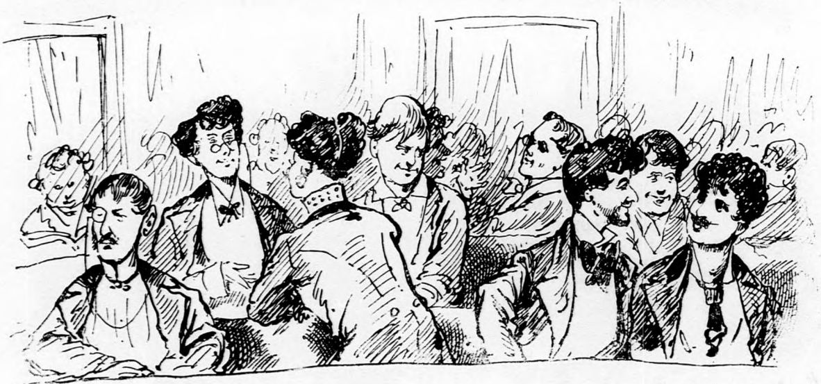
Az 1875—1879-iki alatt a honatyák mamái .