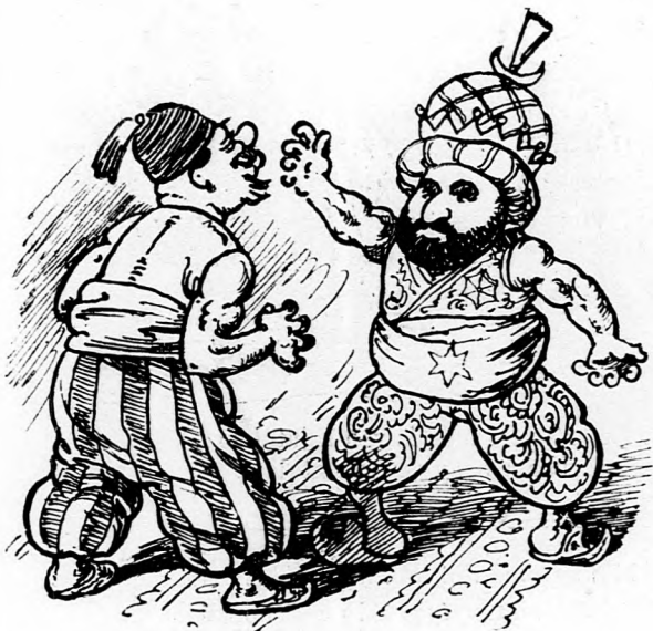
1. Izmos legény, érzi karja erejét. Amde egyszer megtalálja emberét.

Mindjárt bele botlanék a nagy okba. ... Török szultán — az a hüre legalább — Minden agát, bégét, bakát földhő' vag