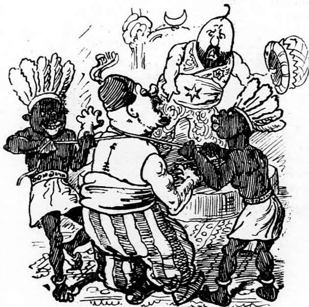
3. Kinek tevel ily bolondot, ó minek? Bolond basa, nyakadon most a zsinég.