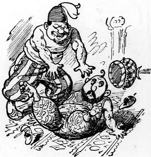
2. Essad basa, izmos legény, nincs eszi, A nagy urat, csak úgy nyekken, leteszi.