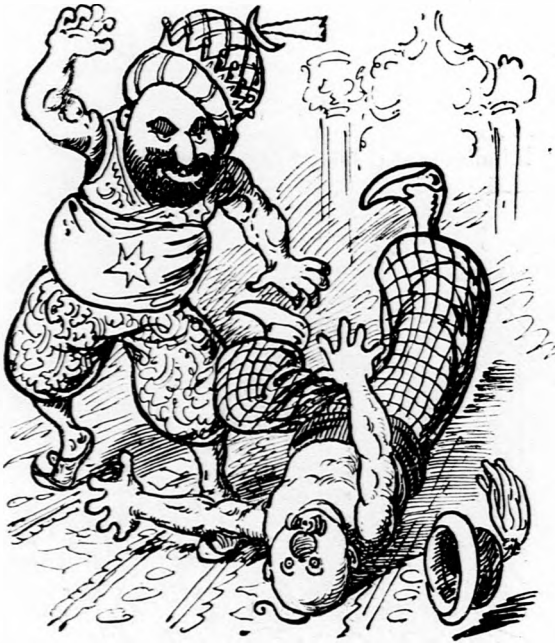
5. Akármilyen keserves is az neki: Kezét, lábát, négy bordáját törethi.