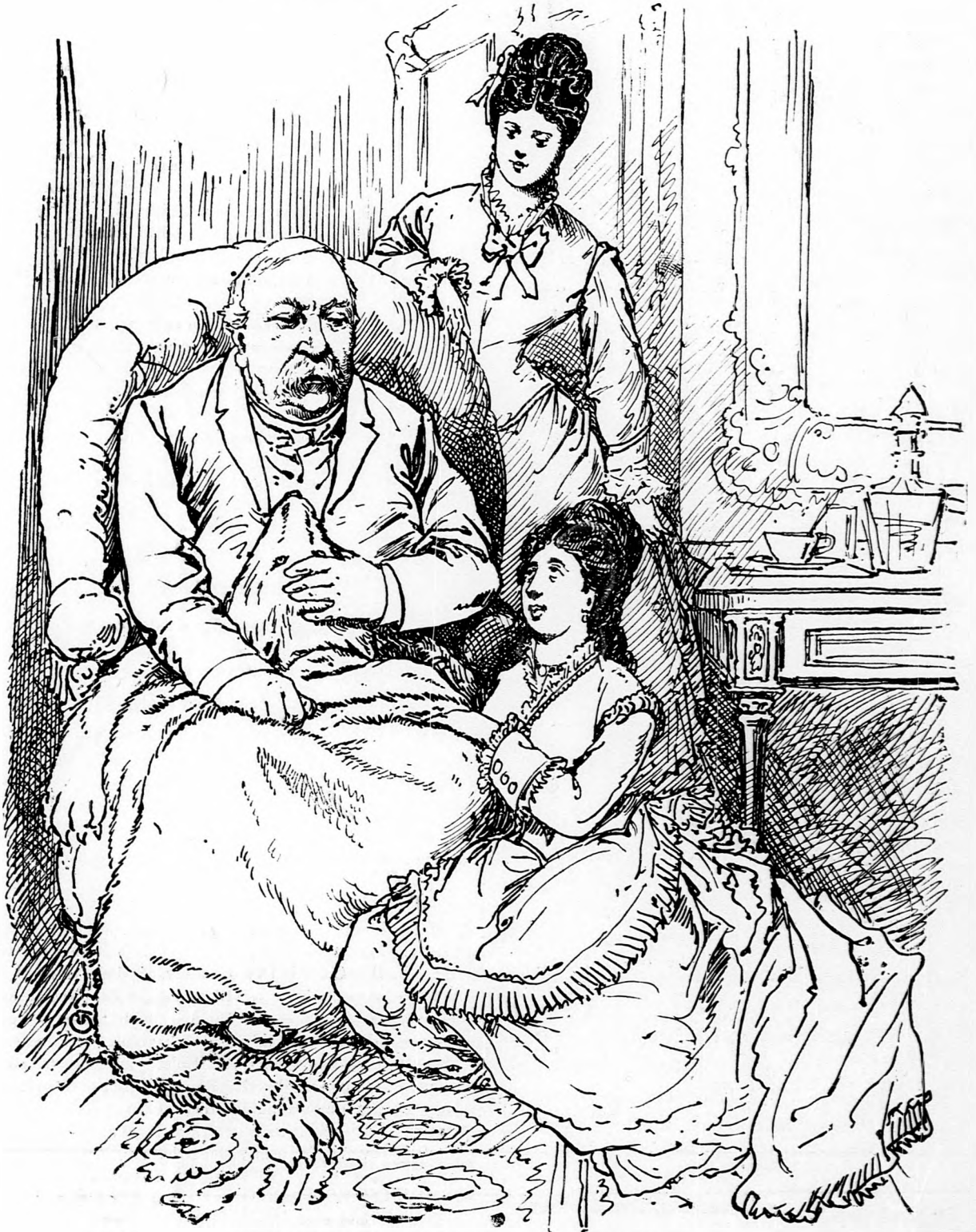
Látjátok, milyen jó a medve bőre Ha az ember nem iszik rá előre.