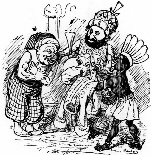
6. Ez erényért meg is van a jutalom: Kezében a nagy vezéri hatalom.