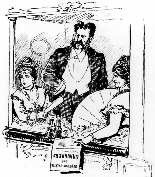
Maguk a Laube »erlauchte Magyáren«-ei pedig ott ragyognak a német Thalia Tempelében.

Mint minden genialis orvos, ő sem volt nagyon udvarias. Volt egy kellemetlen betege, a ki mindig zsémbelt, mindig morgott s az orvos rendeleteinek még sem engedelmeskedett soha. Egyszer azt a nótát kezdte fujni a zsémbelődő beteg, hogy — természetesen a rendelt orvosság miatt — sem ülni , sem feküdni , sem állni , sem járni nem tud. — »Ugy hát nem marad más hátra — mondja K. . . bácsi, mikor már elvesztette türelmét, — mint hogy akaszsa fel magát .«