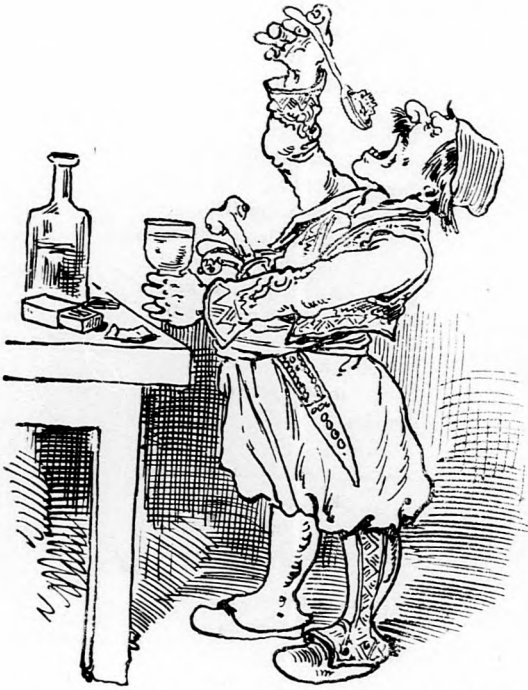
1. Alimpies Ranko tábornok erélyes előkészületeket tesz, hogy Bjelina erősséget bevegye.