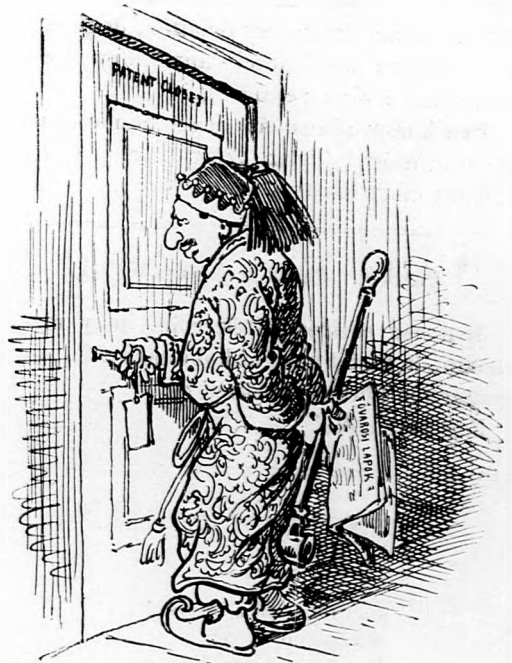
4. A szultán egészségi állapota aggasztó. Mindennap háromszor visszavonul kabinjába, s oda senkit sem bocsát magához, még a minisztereket sem.