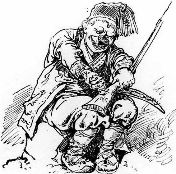
3. S heves küzdelem után teljesen szét is zuzta azt.