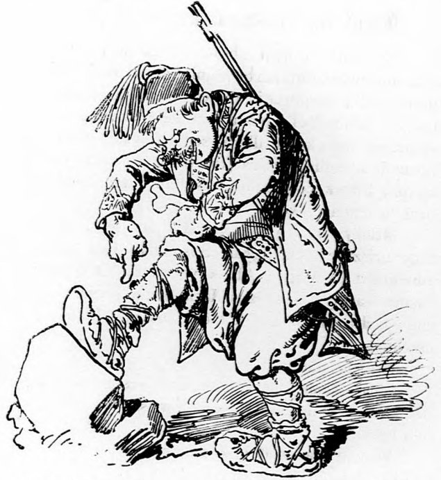
2. Csolak Anties ezredesnek ovatos mozdulataival sikerült az ellenséget meglepni,