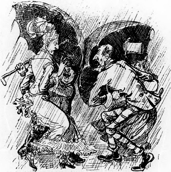
6. Ha az ember nem lát, akkor szeme nincsen: Csak magát őrizvén, hogy másra tekintsen; Egymásba ütődik a két vak paraplé, S idegen nyakba csurg a menynyei csap-lé.