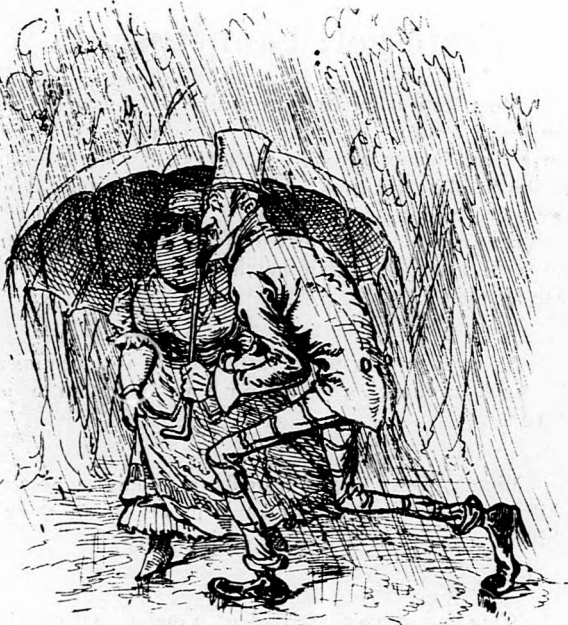
5. Czukli urnak sorsa hasonló esetben Még roszabb; a midőn felhők órra cseppen: Neki az egeből a földre leszállva, A dereka görbül s meghajlik a válla.