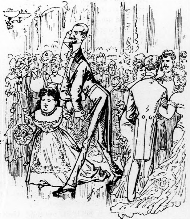
8. De halálos vétek volna Czukli urtól, Ha ő »czupászolna«, hol Gömböcz nem »furtol«. Vele is megjelen bájos oldalborda: Igazi honleány, magyar köntöst hord »a«.