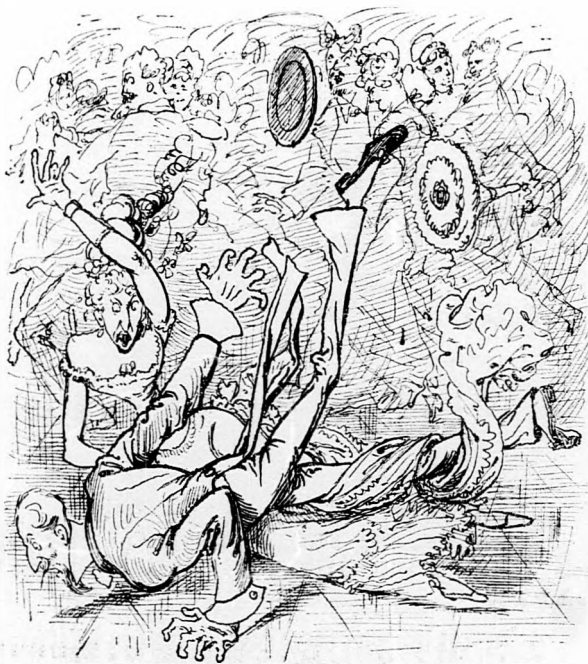
14. Hasonló szerencse nem érhetette Csuklit; Mert midőn alóla a lába kicsuklik, A mi földre hullott, az bizony mind csont volt, S ugyan meglátszott ott egy hétig a bronz folt.