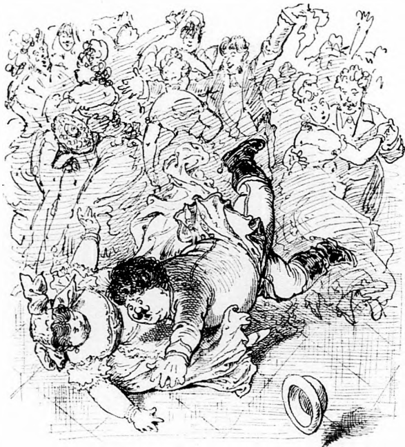
13. Elbizakodásnak megadják az árát: Hanyattvágja magát és tánczó párát Gombóc ur. Szerencse, hogy puhára estek, Nem szenvedett semmi kárvallást a testek.