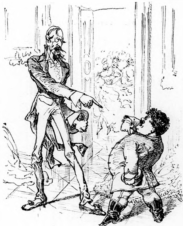
15. A kölcsönös bukás okoz vitát már is, S a vita lett immár unparlamentárisch: Mind a két sértett fél kimondá nagy mérggel, Hogy az ily bántalom lemostához vér keli