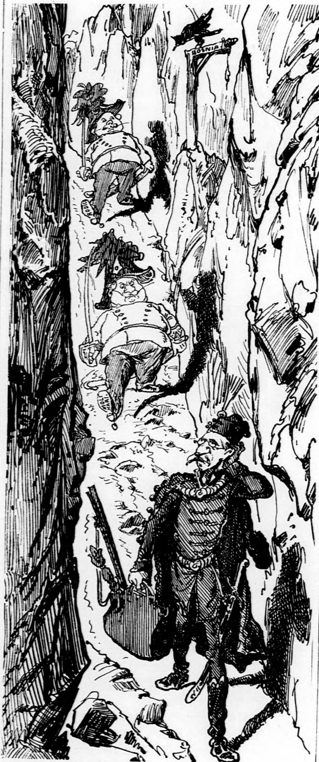
Róka szoros egykor nagy ehetnám lyukba behujta. Dombos az oldala volt, nem lehet ám gyere ki!