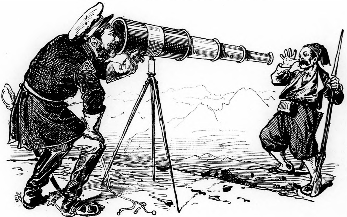
»Az ellenség tiz mérföldnyi távolban áll előttünk s igen csendesen viseli magát.«