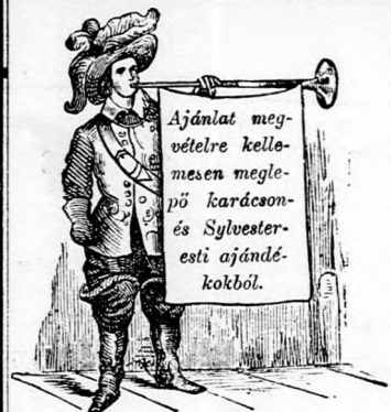
A helyiségben a választást könnyítő rendszeres kiállítás van rendezve, minden tárgyon látható szabott árval.

Tisztelt vidéki vendüimnek ajánlok becses figyelmükbe, esetleges megrendeléseiket nem az utolsó napra hagyni, mert az eddigi tapasztalások szerint olyankor az üzlet teendőikkel tulhalmozva van. Továbbá kérem a küldendő tárgynak legalább megközelítő árát velem tudatni azon este, ha képes árjegyzékem netán kéznél nem volna (melyben a cizkék legkülönfélébb szabott aítai feltalálhatók.) Mintfogó üzleti czélökből tett külföldi utam udjónságra nézve igen zsi eredménynyel járt, azon kellemes reményt táplálhatom, ez ideén a leggyengédebb s legkényeseb izlést is kielégíthetm.