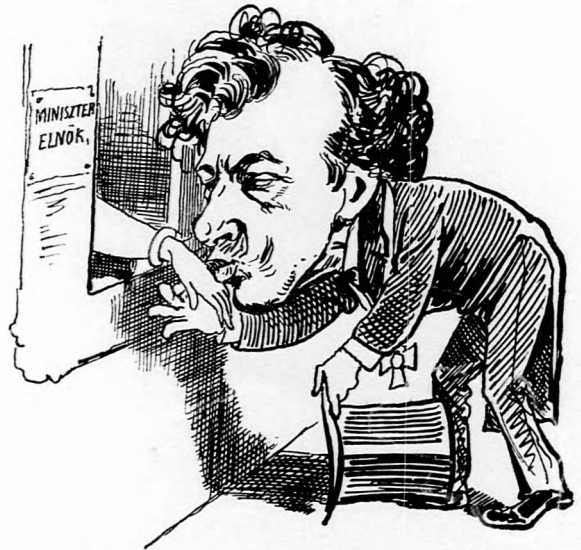
3. Lehessek szerencsés, magam és elvtársaim nevében mély hódolattal felkérni excellenciát: fogadja el a lady patronesseságot a bálunkban. (Ma III-ik Richardnak érzem magamat.)