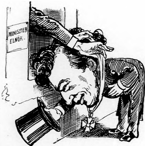
1. Ez éltem legdicsebb napja! (Ma Essexnek érzem magamat!)