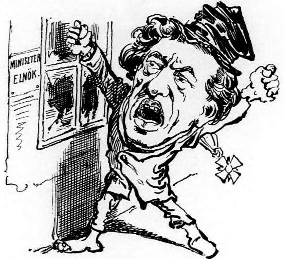
2. Abzug neki! (Ma Brutusnak érzem magamat: az az, hogy Lajosnak.)