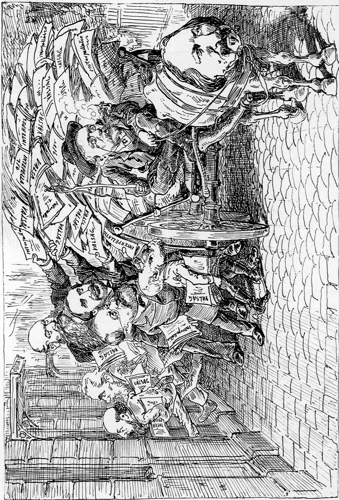
Mikor a vén csata-ló szemetes kocsit húz.