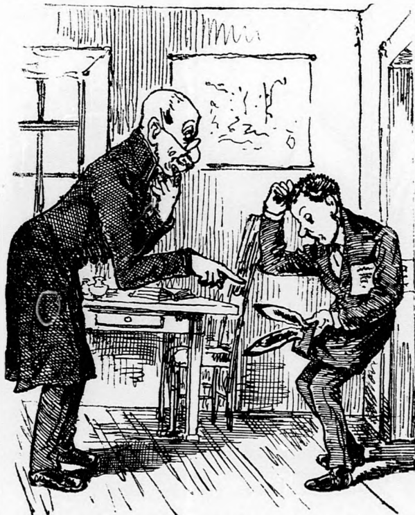
A diák a kabátszárnyakra pilantva, szem-

— Hé, domine Bordás! kiáltja végre a nyulfülekre mutatva; nem felejtett itthagyni valamit?