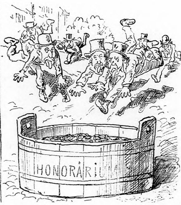
A hajsz után.