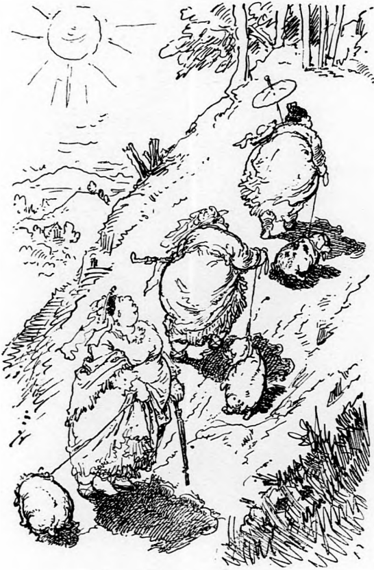
Föl a Disznófőnek!