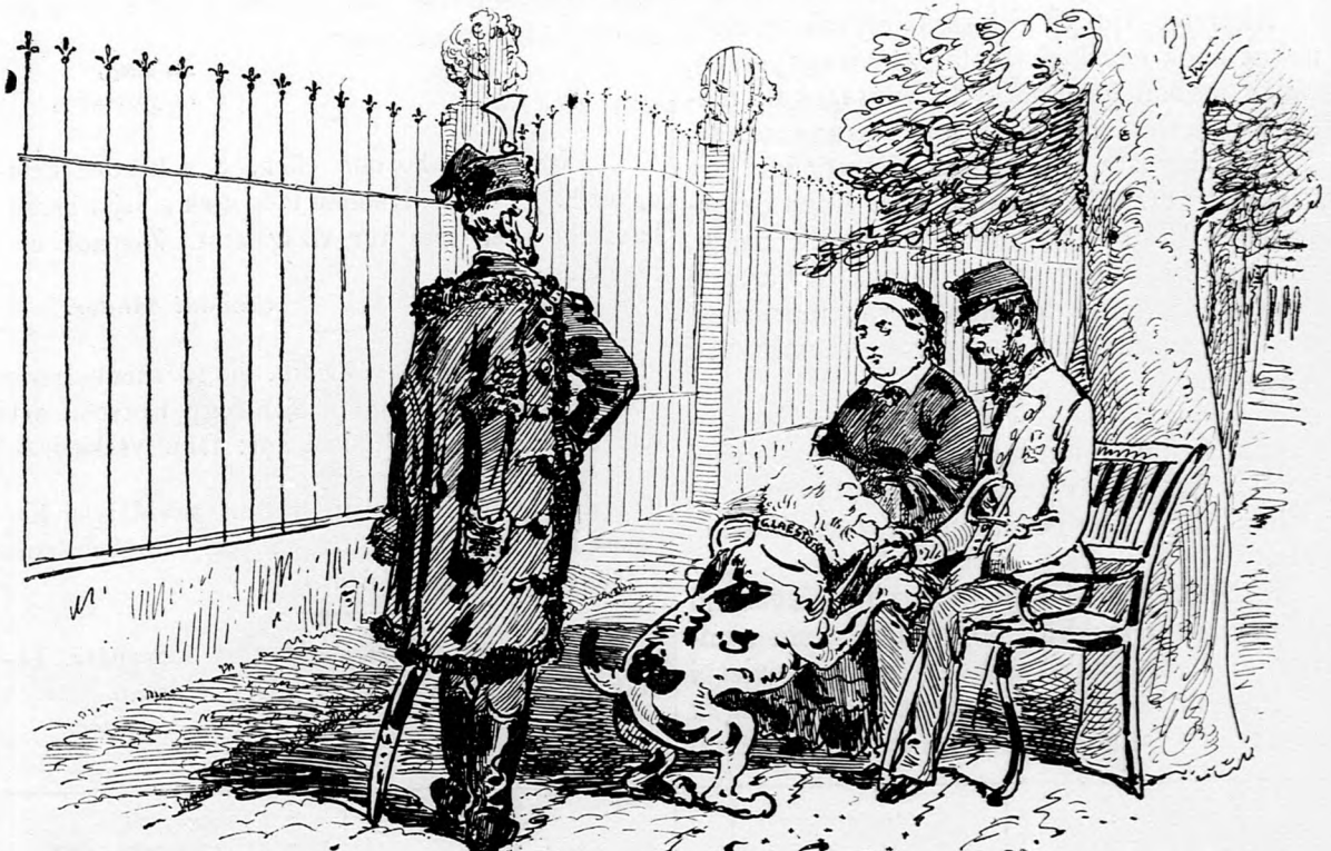
Igen udvarias és tanulékony teremtés a kerítésen belül.