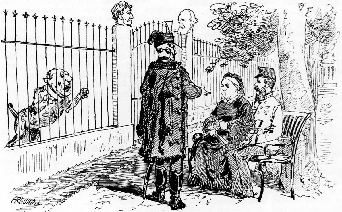
„Ugató kutya“ a kerítésen kívül.]