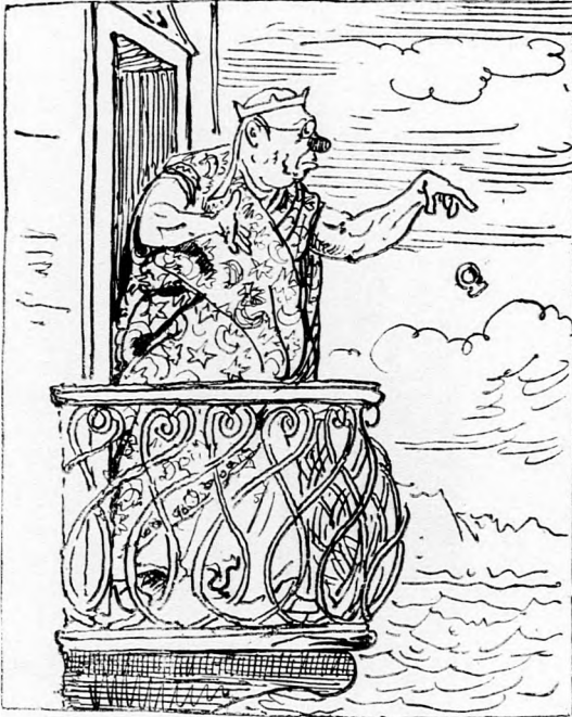
»Imhol egy echt gyűrű, Laukától vettem, Jó lesz áldozatul nekik ezt bevetnem.«