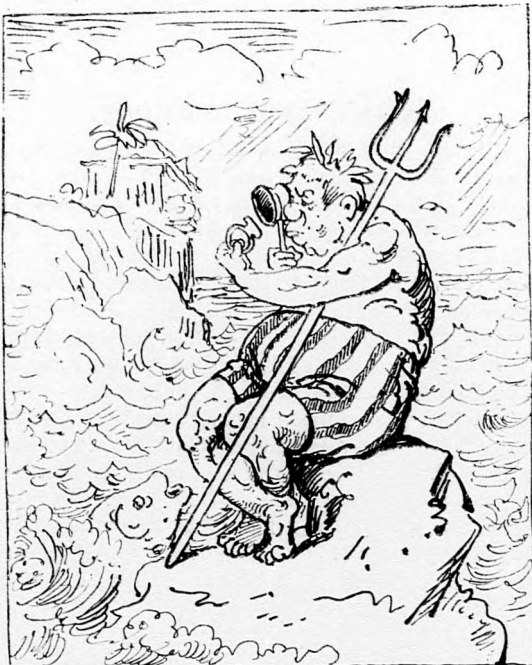
De nem mégy ám Neptun oly könnyen ajlépre: »Mit? csak nyolcz próbás? és cseh gyémánt az éke?«