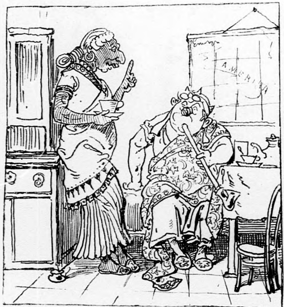
»Szép, — szól Amazisz, — de az a sorja ennek: Áldozz már valamit a nagy isteneknek.«