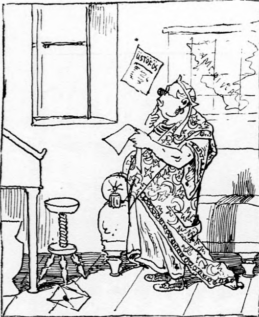
Polykratesz, Szamosz ura, magát unja, Unalmában hát az ujságokat bújja.