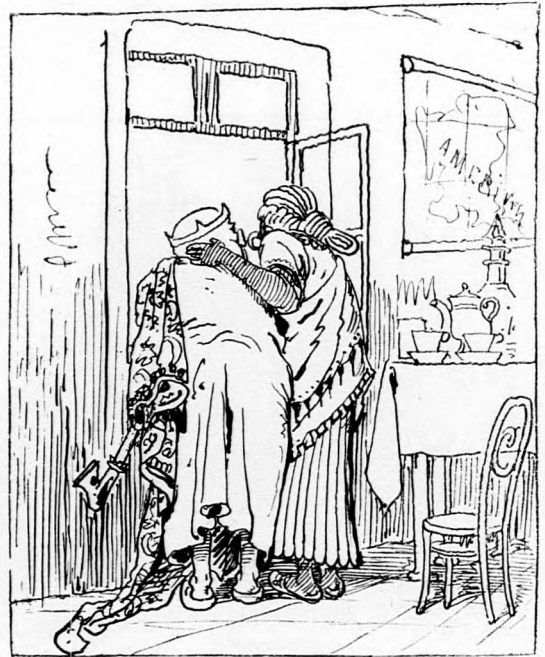
Viszi az ablakhoz: »No nézz széjjel itten, A mit csak beláthatsz, enyém e sok minden.«