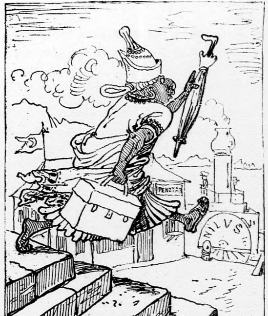
Egytom királya haza fut, s visiti: »Hah! hát már e korba beütött a svindli?«