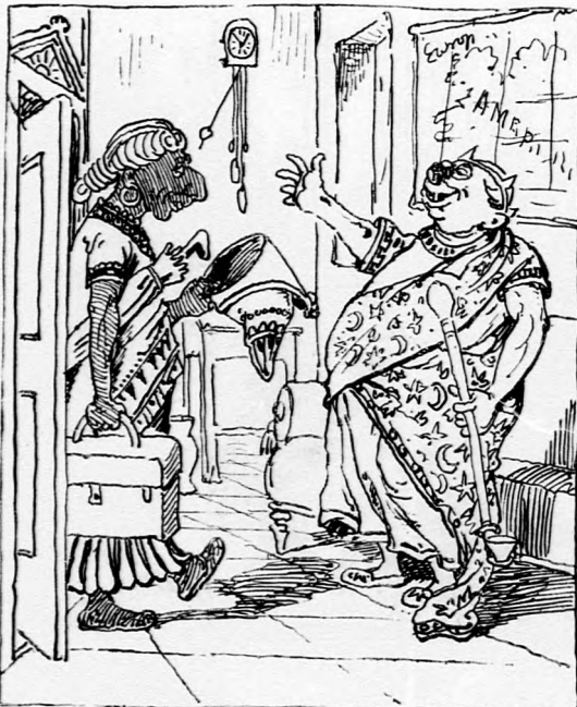
Örömet hoz neki ünnepe délutánja: Egytom királya vizitet csap nála.