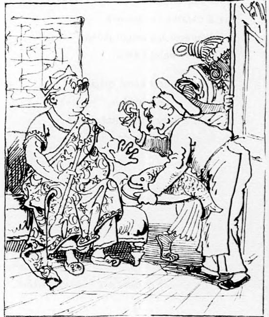
Vissza küldi Neptun a gyűrűt egy halba'; Reznek zöld mérgitől van a hal meghalva.