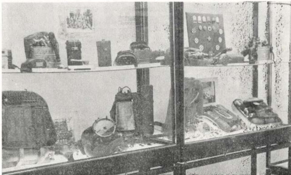
A bányamentés eszközeit bemutató tárló

1977. november 5-én megnyílt a pécsi és a mecseki bányászat múltját-jelenét bemutató állandó Bányászati Gyűjtemény. Kilenc éve indult meg az az átfogó gyűjtőmunka, amelynek eredményeképpen ma több ritkaságszámba menő bányaföldtani szelvény és térkép, közel kétezer tárgyi emlék és nyomtatvány alkotja a me-