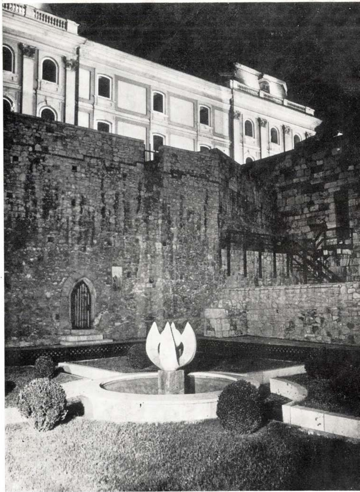
A budai vár