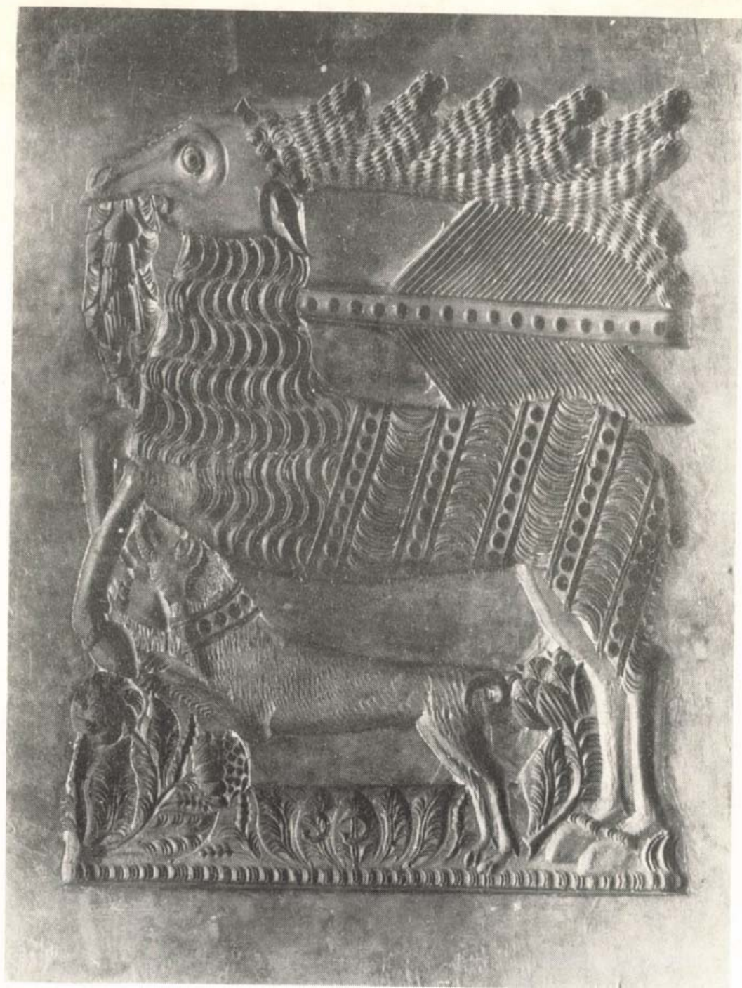
Mézeskalács (bábsütő) díszítő minta A komárnói Dunamenti Múzeum gyűjteményéből