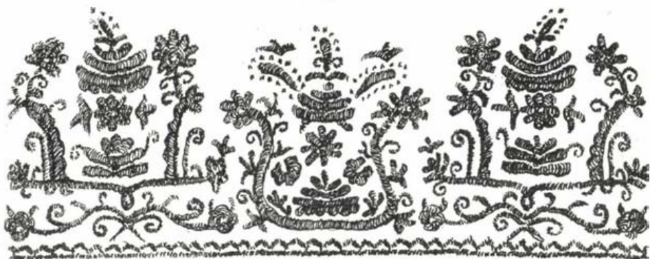
Mezőségi hímzés (Hornyák László rajza)