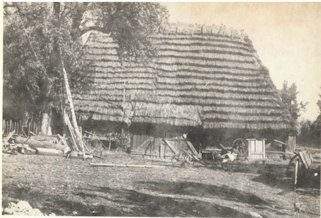
Csűr, Regéc