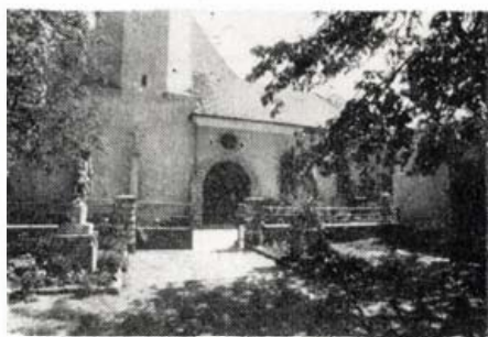
A széleskúti templom, ahová Bornemissza Pétert eltemették