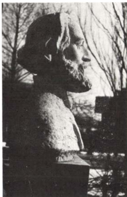
Perczel Mór szobra. Bonyhád, Szabadság tér

A múlt század első felében Magyarország a bécsi félglyarmatosítás állapotában tengődött. A fejlődés a feudális társadalom megmerevedett rendszerének felszámolásától függött. Az antifeudalizmust akkoriban két kérdés jelentette: a jobbágyfelszabadítás és a közteherviselés. A köznemesi birtokos családból származó Perczel Mór álláspontja a jobbágykérdésben nagyon világos: „ A pór is ember, mégpedig olyan, mint a nemes. ” Amikor 1848 nyarán úgy látta, hogy a jobbágyfelszabadítás nem elégítette ki a szegényparasztságot, a tövény továbbfejlesztését javasolta a népképviselői országgyűlésen.