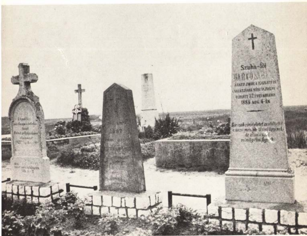
Bartók Béla apjának és nagyszüleinek sírja Nagyszentmiklóson (Móser Zoltán)