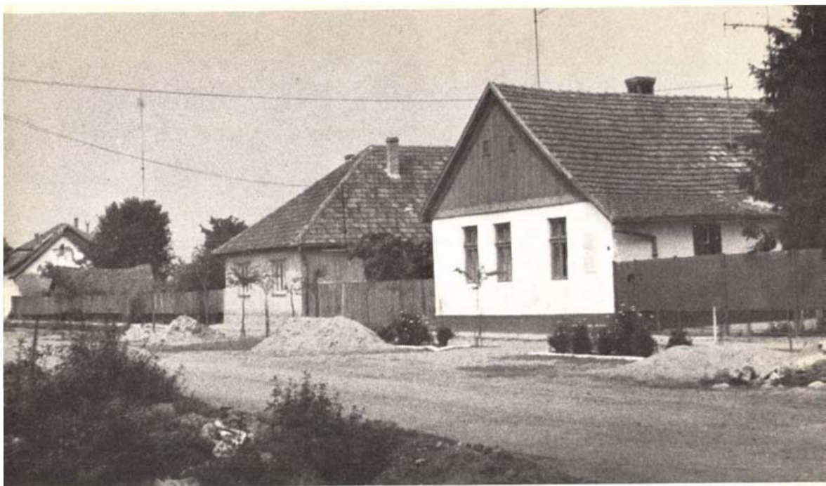
Bartók Béla szülőháza Nagyszentmiklóson