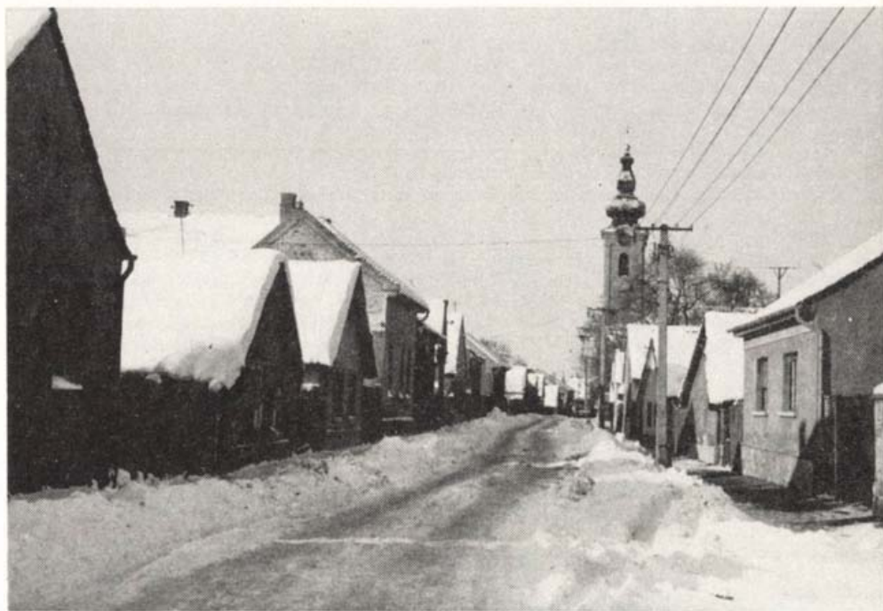
A székesfehérvári Rác utca a rác templommal, amelynek műemléki környezete lesz a Palotaváros Skanzen