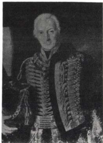
(Rieder János festménye)