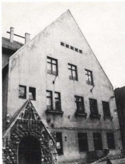
A Városmajor utcai iskola bejárata