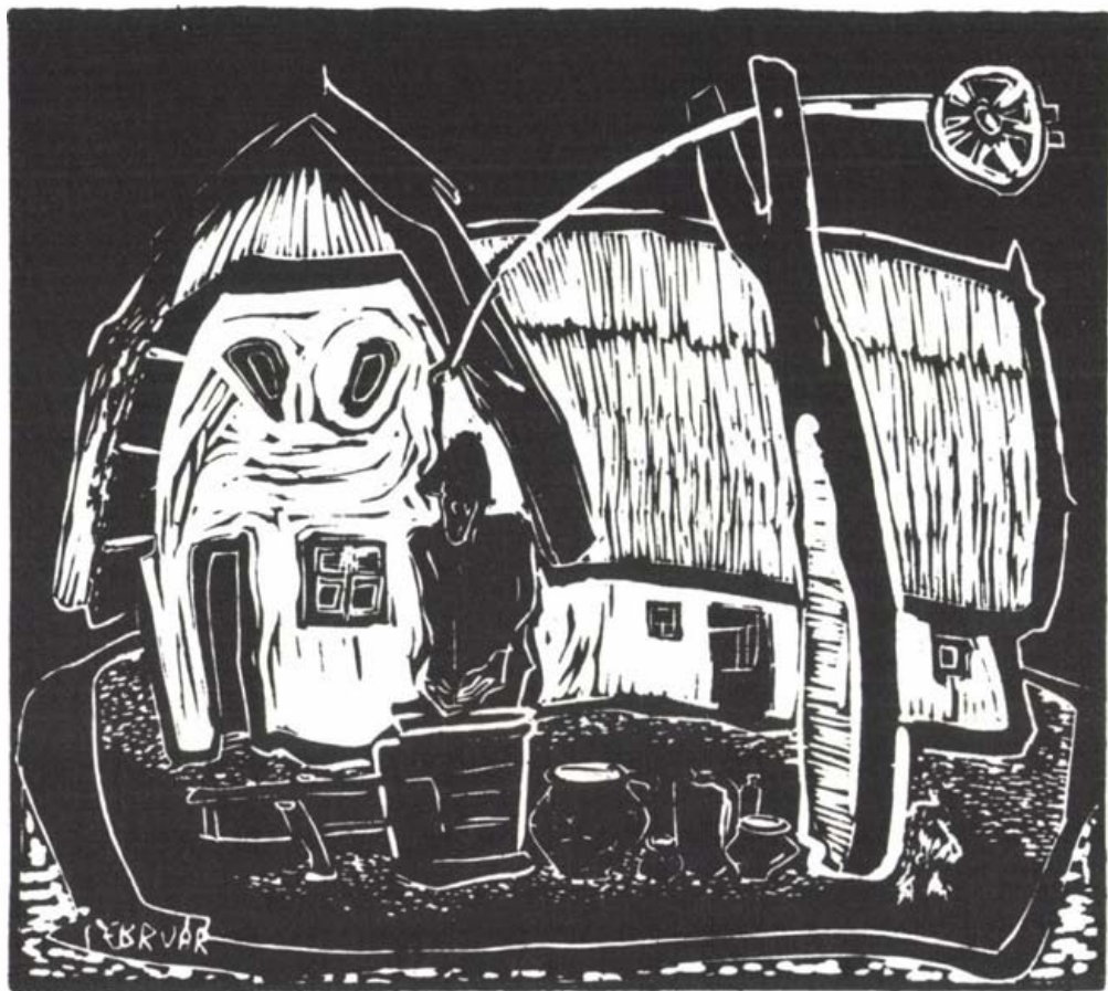
Szilágyi Imre grafikája, 1969