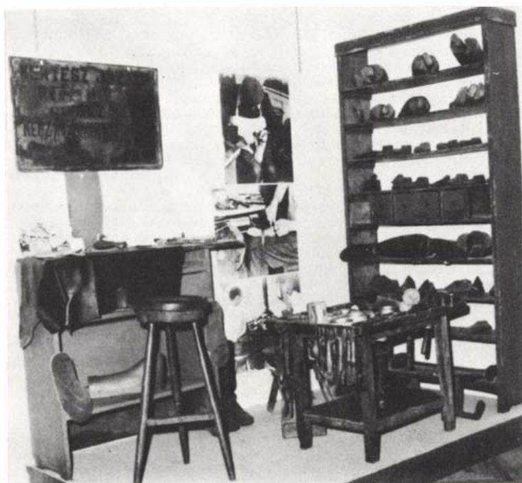
Cipézműhely a Helytörténeti Múzeum állandó kiállításán