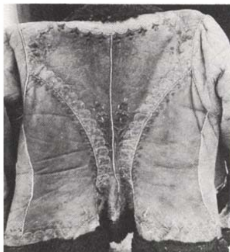
Női ködmön

Palást (Plaštovce) palóc község az Ipoly jobb partján a Korpona-patak mellett. Hagyományörző település, lakói valamikor elsősorban földműveléssel és állattartással foglalkoztak. A századforduló táján a községnek több fogadott pásztor is volt.