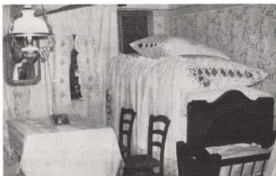
Szobabelső a bajai bunyevác-délszláv tájházban