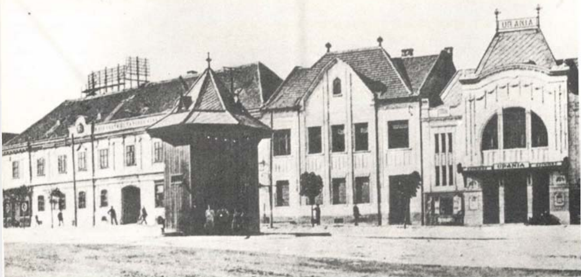
Keszthely: Liaház