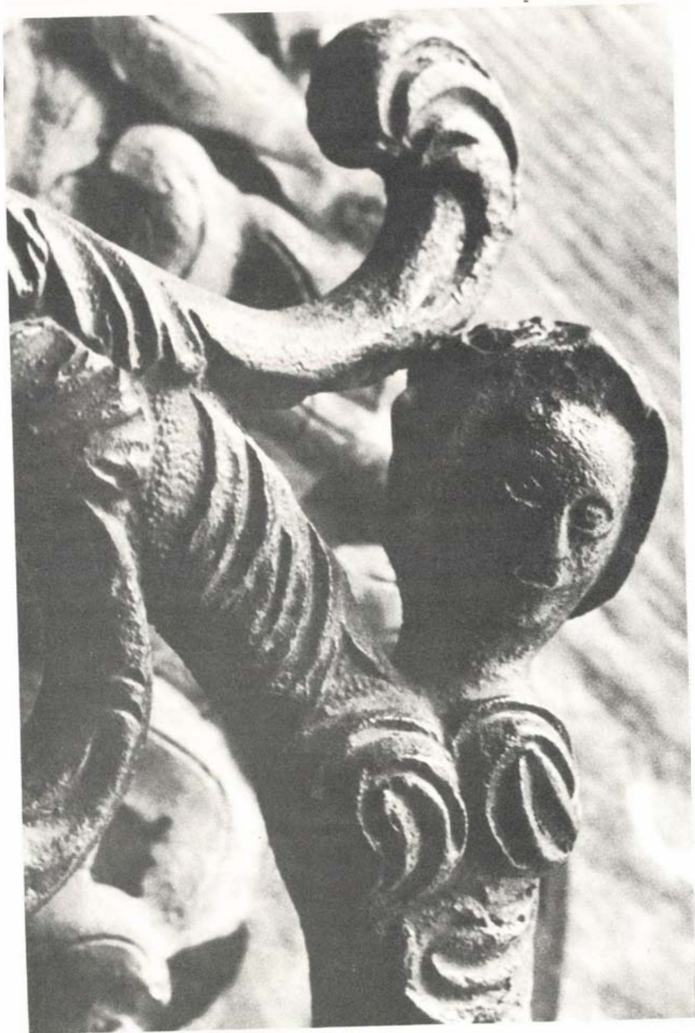
Vaskoppantó, Sopron