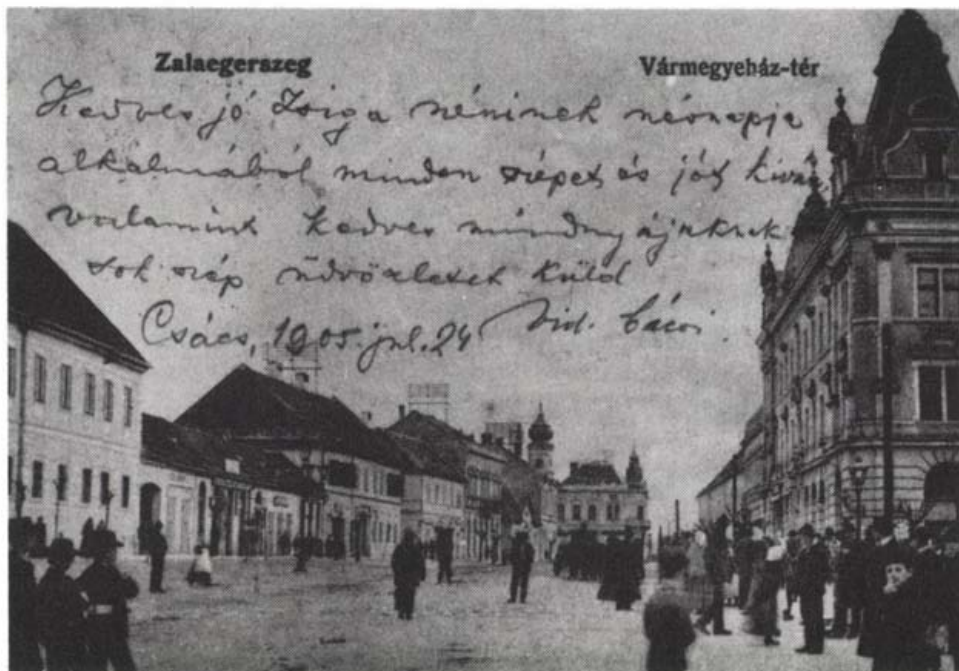
Zalaegerszeg, Vármegyeház tér 1905-ben

Időközben bővítették a huszárlaktanyát is, mert a honvédség egy önálló lovasságot (teljes osztály huszárt) szeretett volna itt elhelyezni, ezt a bővítést is vállalta a város, pedig anyagi ereje már nagyon kimerülőben volt, sőt évek óta kölcsönökből fedezte a középítkezéseket. Már a vasútépítés kezdeténél, 1886-ban 300 000 forint felvételére kényszerült, s az építkezések előrehaladtával a felvett összegek egyre nö-