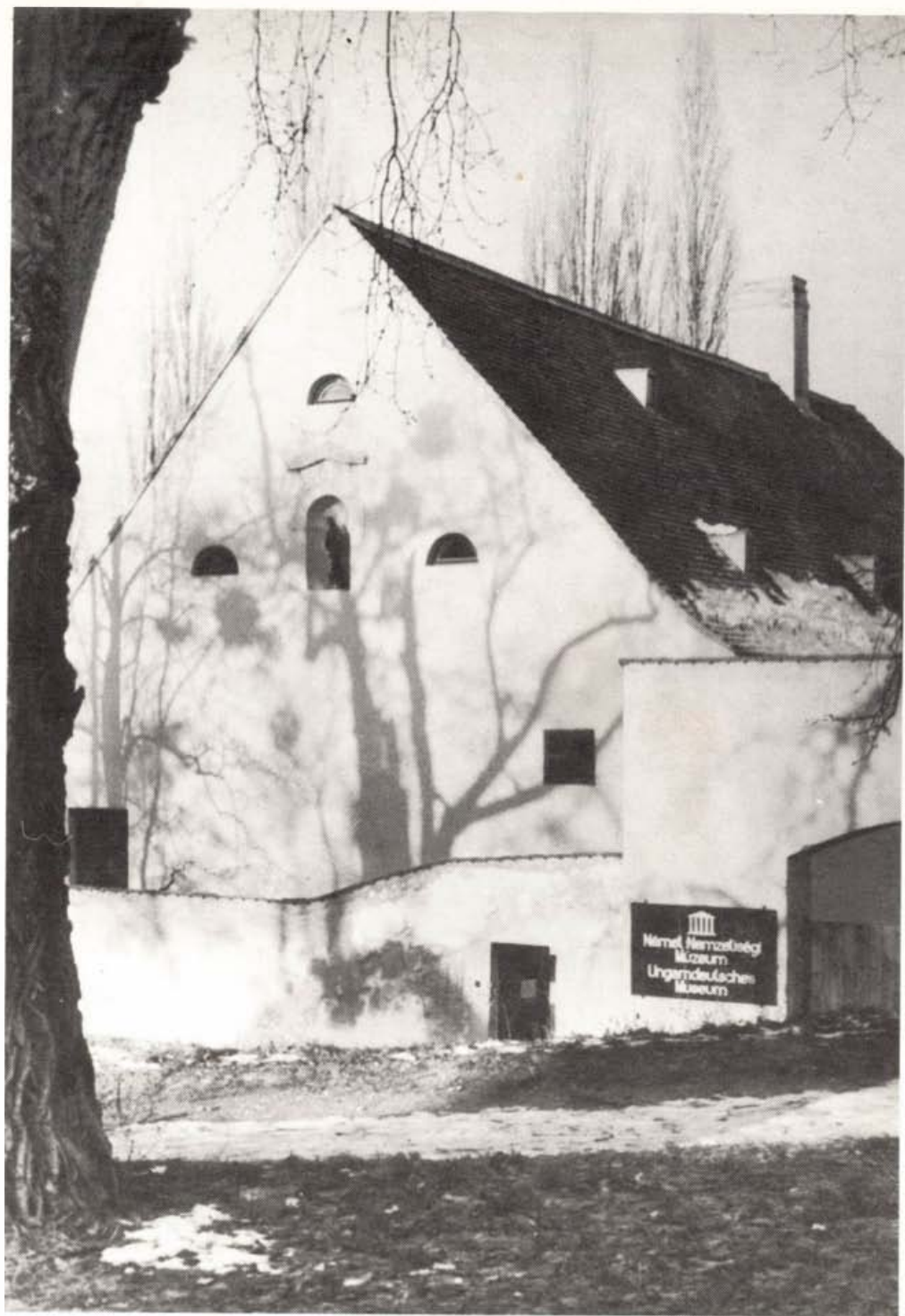
Német Nemzetiségi Múzeum Tatán