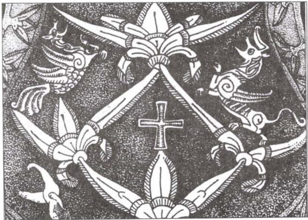
A tiszabezdédi tarsolylemezt részlete