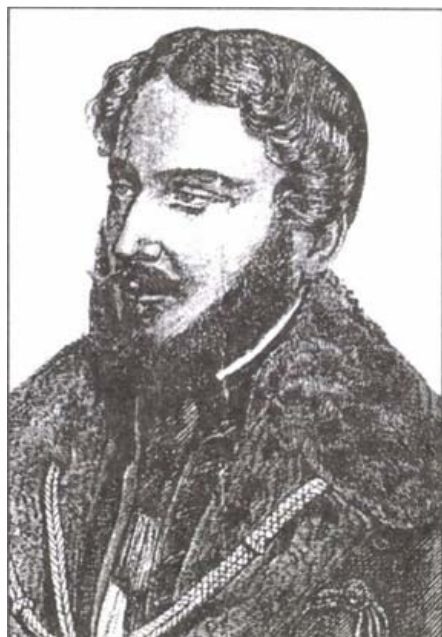
Gr. Károlyi György

1845. szeptember 27. – október 17. közötti társulati szervező útján Széchenyi végigutazta a Tisza-mellékét. Sok helyen megfordult, buzdított, tárgyalt, barátokat szerzett a Tisza szabályozás ügyének. Visszatérve Pestre, sietett jelentést tenni tapasztalatairól a nádornak, elgondolásait kifejtő röpiratát, az Eszmetöredékek, különösen a Tiszavölgy rendezését illetőleg címmel. Ezt kinyomtatva, megküldte az összes érdekeltnek. A Tiszavölgyi Társulat alakuló ülését 1846. január 19-re hívta össze Pestre a Károlyi-palotába. A palotát mai formájában gróf Károlyi György, Károlyi Antal unokája tervezte 1832-ben, az egyik forrás szerint először Pollack Mihállyal, majd Anton Pius