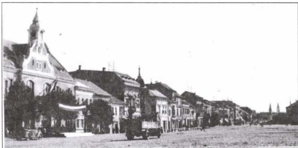
Szászrégen főtere (1941)

A kapitalista termelési viszonyok elterjedése serkentőleg hatott a város gazdaságára, ipari és kereskedelmi tevékenységére. A gazdasági fellendülés nyomán Régen a Felső-Maros vidék egyik ipari és kereskedelmi központja lett. E szerepének elismeréseként 1863-ban szabad királyi jogú várossá nyilvánították. 17 Két járásnak és 66 falunak lett a központja: az alsó járáshoz 41, a felsőhöz 25 falu tartozott. 1872-ben törvényhatósági joggal ruházták fel. Ezt a jogát az 1876. XX. tc. értelmében megszüntették és az akkori Maros-Torda vármegyéhez tartozó rendezett tanácsú várossá nyilvánították. 18