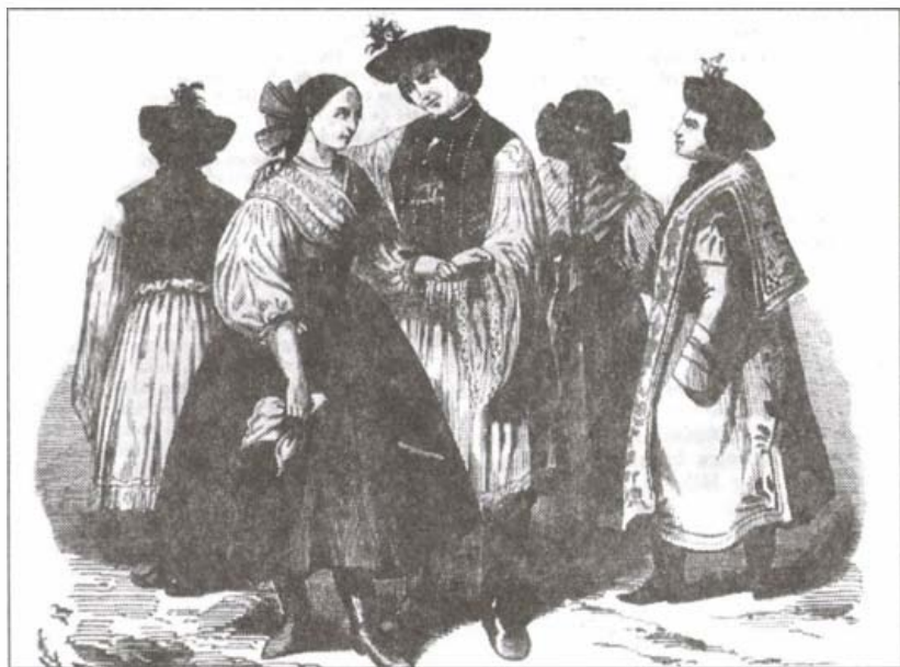
Egri Népviselet ábrázolása a Vasárnapi Újsághoz