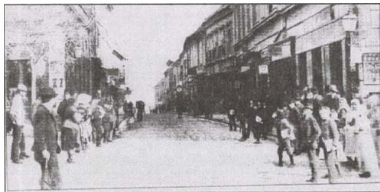
A Király utca a Széchenyi tér felől 1890 körül