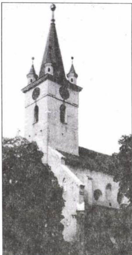
Szászrégeni evangélikus templom

Szászrégen régmúlt időkre tekint vissza. Feltételezik, hogy a római korszakban (106-274) erődítmény állott a mai evangélikus temető helyén, hiszen elődeink ezt a helyet „Várhegy-Burgriech”-nek nevezték. A rómaiak jelenlétéről tanúskodnak a Régenben és környékén talált pénzletek, a castrumok és a kőburkolatú római út maradványai. A hagyomány szerint a római telepnek a neve – ahol ma Szászrégen fekszik – Rucunium volt. Régen és környéke a magyar feudális állam keretében királyi föld volt; a közeli Görgényszentimrén királyi vár létezett. A XII. században, II. Géza király uralkodása idején, Németország déli részéből német telepeseket fogadtak be erre a vidékre. Első írásos említése – REGUN – néven 1228-ban történik, amikor II. Endre király a Gertrud elleni összeesküvésben részt vett Simon bántól elkobozott Régen környéki birtokokat a Tomaj-nembeli Dénes tárnokmester-