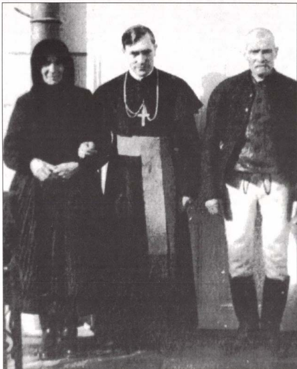
A püspökszentelés után, szüleivel. 1939. február 12.

Isteni rendelésnek tekinthetjük azt, hogy 1938 karácsonyán a pápa éppen őt, az akkor 42 éves papot találta alkalmasnak arra, hogy betöltse a gyulafehérvári püspöki széket. Márton Áron munkája akkor már évek óta hatással volt az egész erdélyi magyartársadalomra, figyeltek szavára a más hitet vallók is. Ekkor már évek óta azon munkálkodott, hogy ez a társadalom érettebben nézzen szembe a kihívásokkal, hogy ne a számbeli fölény, ne a hatalmi érdek, hanem a minőség legyen a meghatározó. A háború kitörésekor ő volt az erdélyi római katolikusok püspöke, így a leghitelesebb személyként szólhatott az elszabadult embertelenség ellen – talán elsőként egész