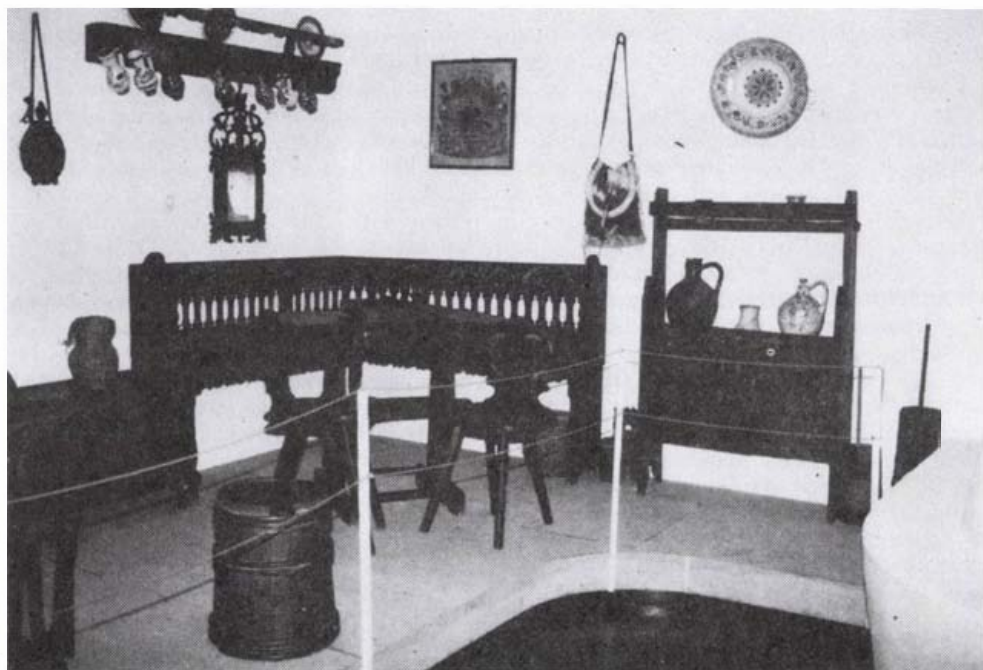
Kántor Sándor Fazekasház. Kiállítás-részlet.

A Kunság népe – más alföldi mezővárosokhoz hasonlóan – már a XVI. században a református hitre tért, és napjainkig őrzi kálvinista jellegét. Csak Mária Terézia szorításának engedve fogadtak be katolikusokat a városokba. A protestáns szellemiség talaján hamar kibontakozik a debreceni Kollégiumhoz kötődő partikuláris iskolarendszer. Mindennek gazdasági hátterét a redempcióban szerzett tulajdon teremtette meg. A redempcióval parasztpolgári fejlődés lehetősége nyílt a Jászkunságon, amelyik a mezővárosi sajátosságokban teljesedett ki.