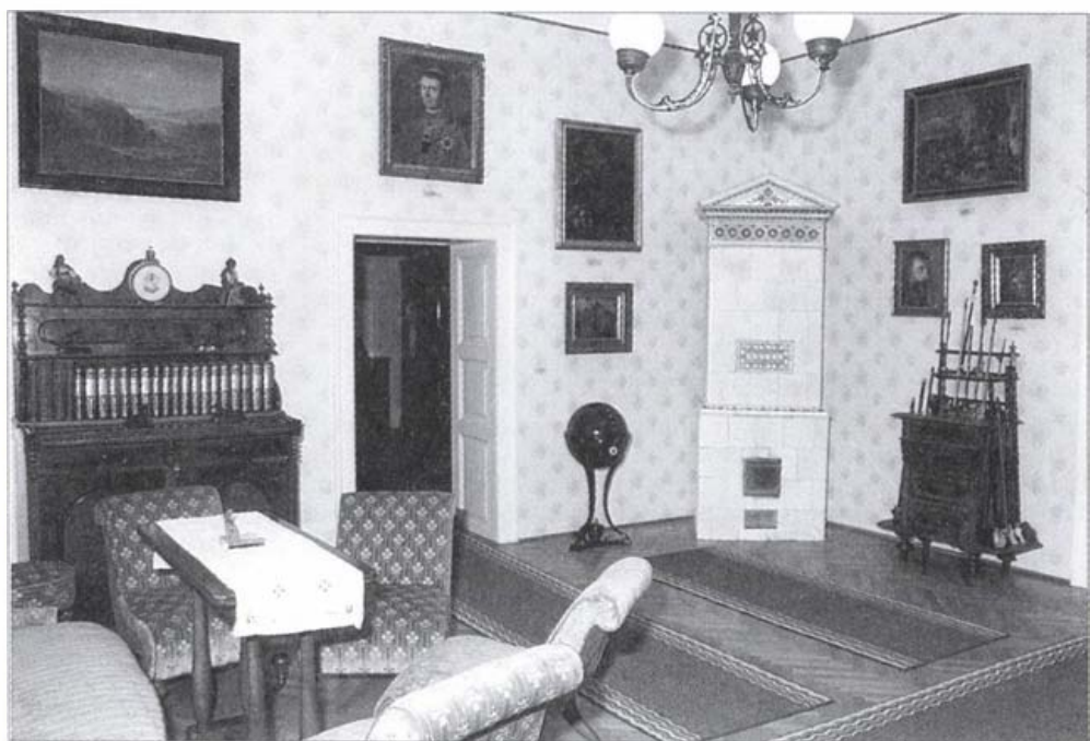
Blaskovich Múzeum nappali szoba