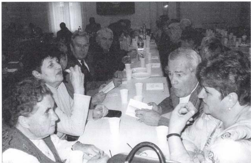
Az ünneplők egy csoportja. Az előtérben a jászdózsai társszakkör tagjai