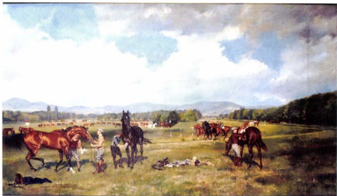
Reggeli munka Alagon (Konrád Ignác festménye, 1941.)