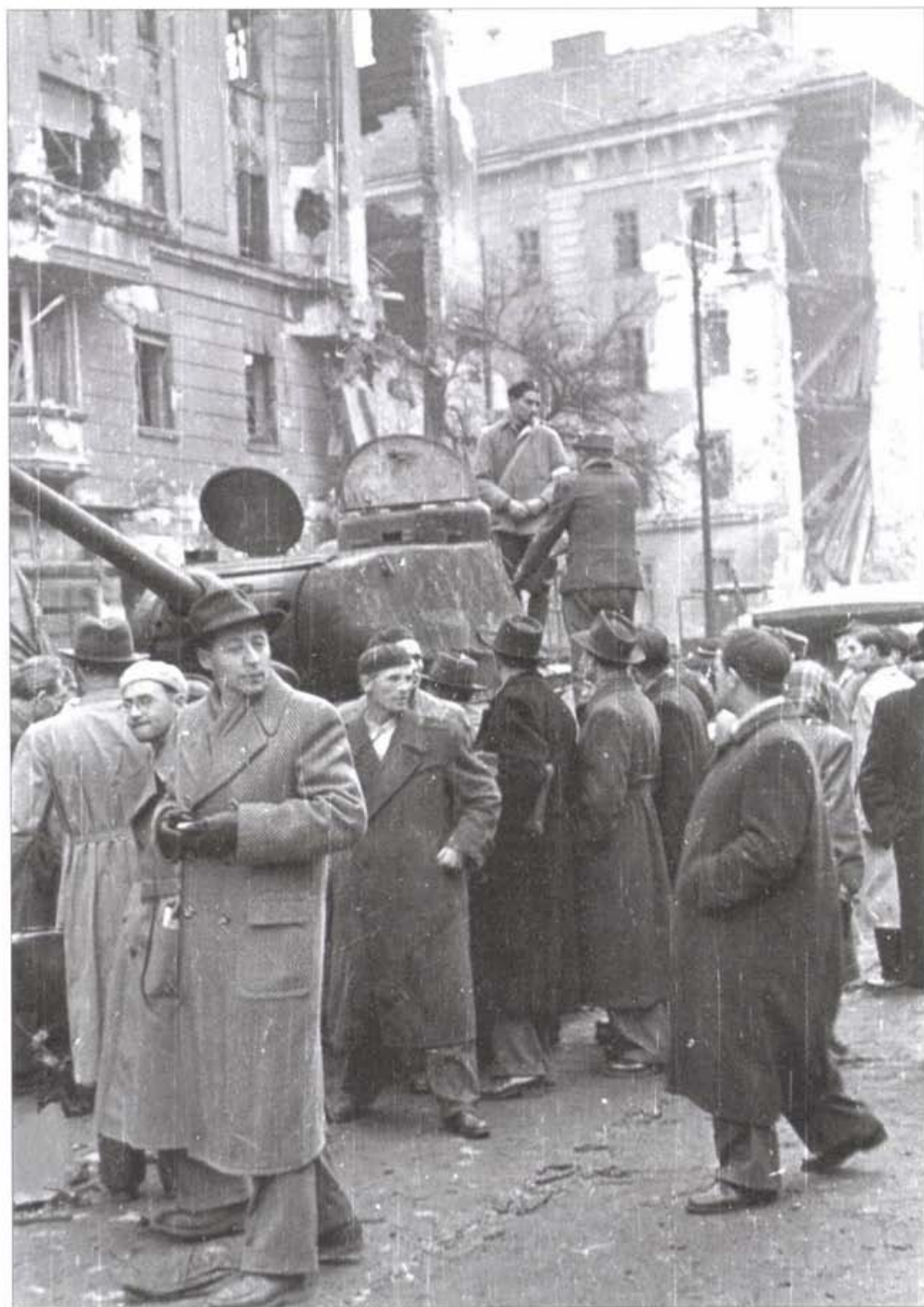
József körút 86. – Üllői út sarok