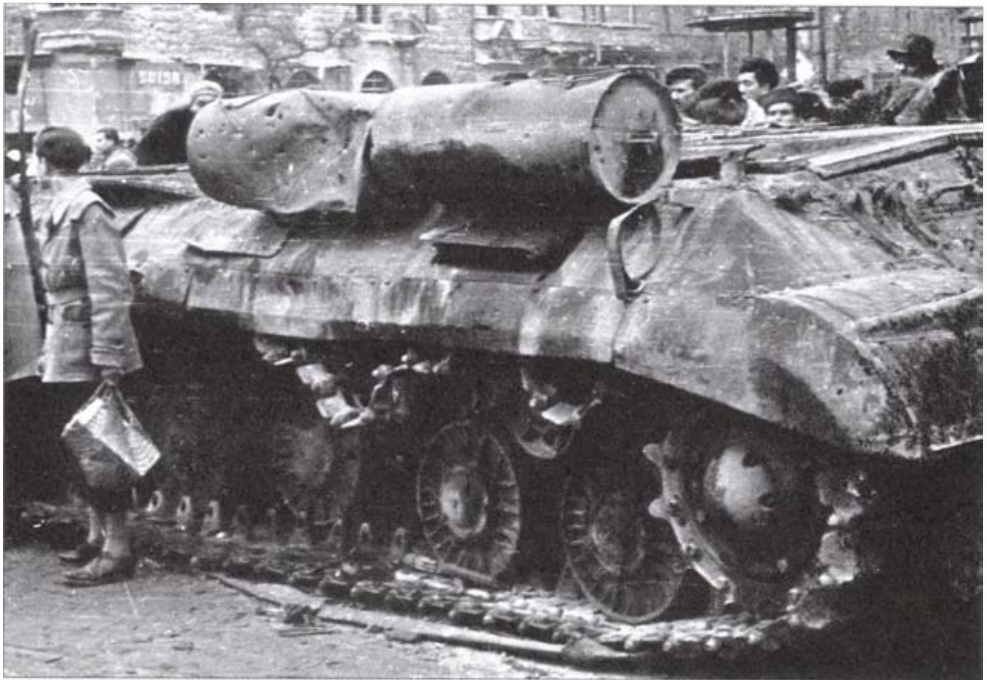
József körút – Üllői út sarok