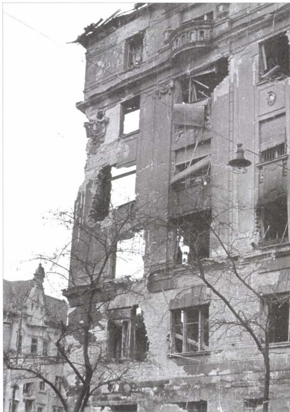
József körút 84. sarok