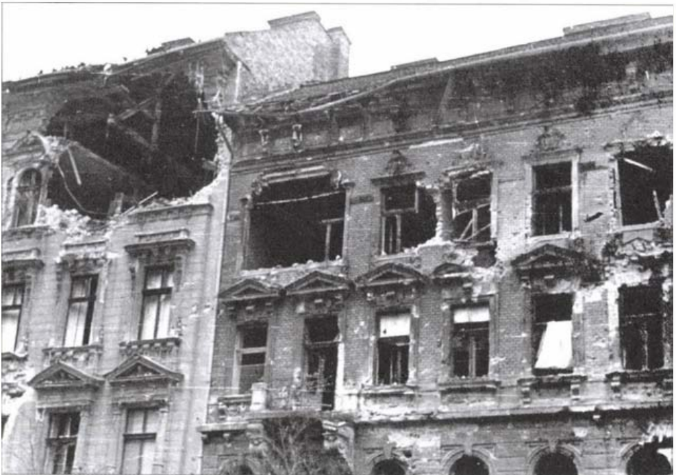
József körút 70–74.