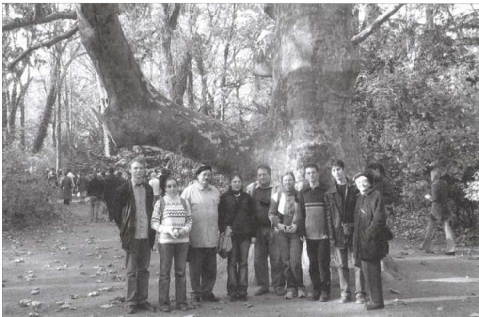
A X. Ifjúsági Akadémia résztvevőinek egy csoportja (Alcsút, 2005.)