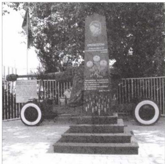
Pesterzsébet, Jutadomb, az esztergomi tüzérsztály katonáinak emlékműve