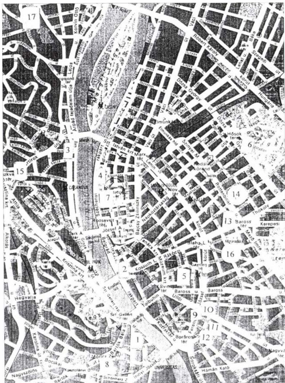
1. Műgyűtem 2. Március 15. tér 3. Bem tér 4. Parlament 5. Rádió székháza 6. Sztálin szobor 7. Pártközpont 8. Móríc Zs. körtér 9. Kilián laktanya 10. Corvin-köz 11. Tűzoltó u. 36. 12. Tompa u 10. 13. Baross tér 14. Péterffy S. kórház 15. Széna tér 16. Köztársaság tér 17. Kiscelli kastély