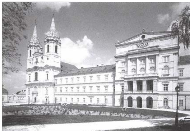
A zirci ciszterciek barokk temploma és rendháza