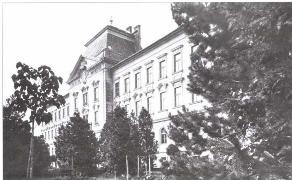
A pápai Állami Tanítóképző Intézet épülete

rával rendelkező város, amelynek egykor három virágzó tanítóképzője volt, egyik napról a másikra pedagógusképző intézmény nélkül maradt. A pápai intézmény megszűnése előtt, 1959 januárjában áthelyezték Győrbe, ahol kettős feladatot kapott. Ő így ír erről: „Győrben 1959. január 1-én kezdtem meg működésemet, s ezzel párhuzamosan a felsőfokú intézet szervezésének minden gondja rám szakadt. Bár az igazgatót már kinevezték, de mivel megtartotta gimnáziumában az igazgatói funkciót, nem vett részt ebben a munkában. Csak amikor az intézet már készen volt, 1959 szeptemberében vette át az intézet vezetését. Mivel azonban fogalma sem volt a tanítóképzés munkájáról, az intézet és a vele kapcsolatos gyakorló általános iskola pedagógiai irányítása teljesen rám hárult. (...) Alig egy év után leváltották és elhelyezték az intézetből.”