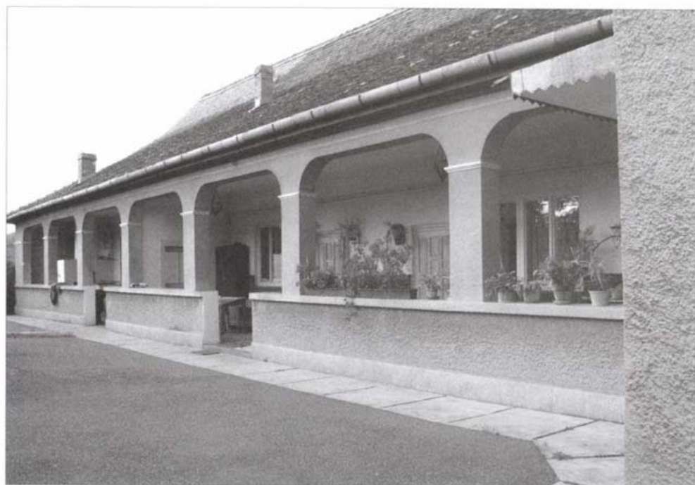
A kocsmá, Fehéregyháza