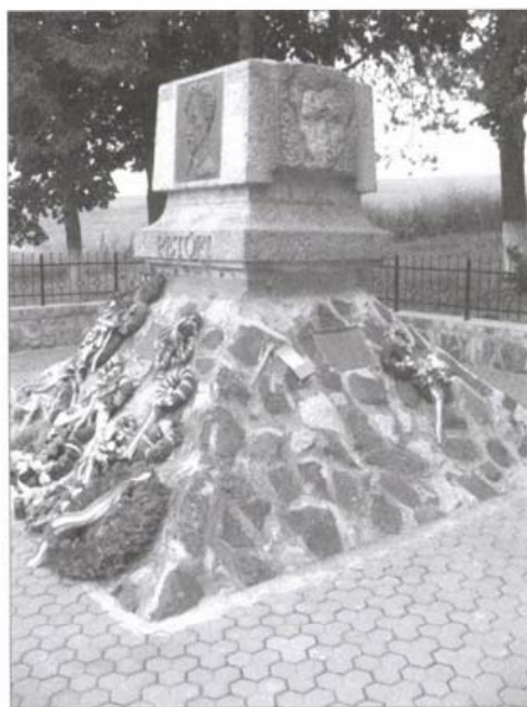
Az ispánkúti emlékhely