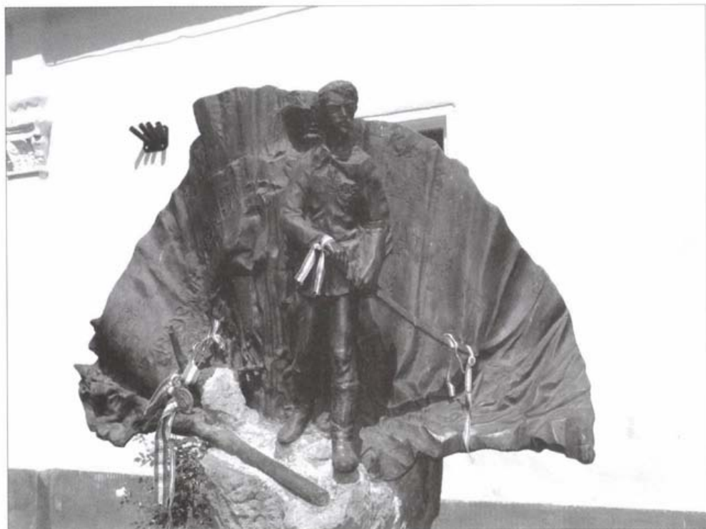
Szobor a Gyárfás kúria kertjében