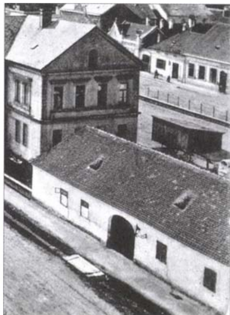
Az új iskola tövében a régi. 1920 előtt