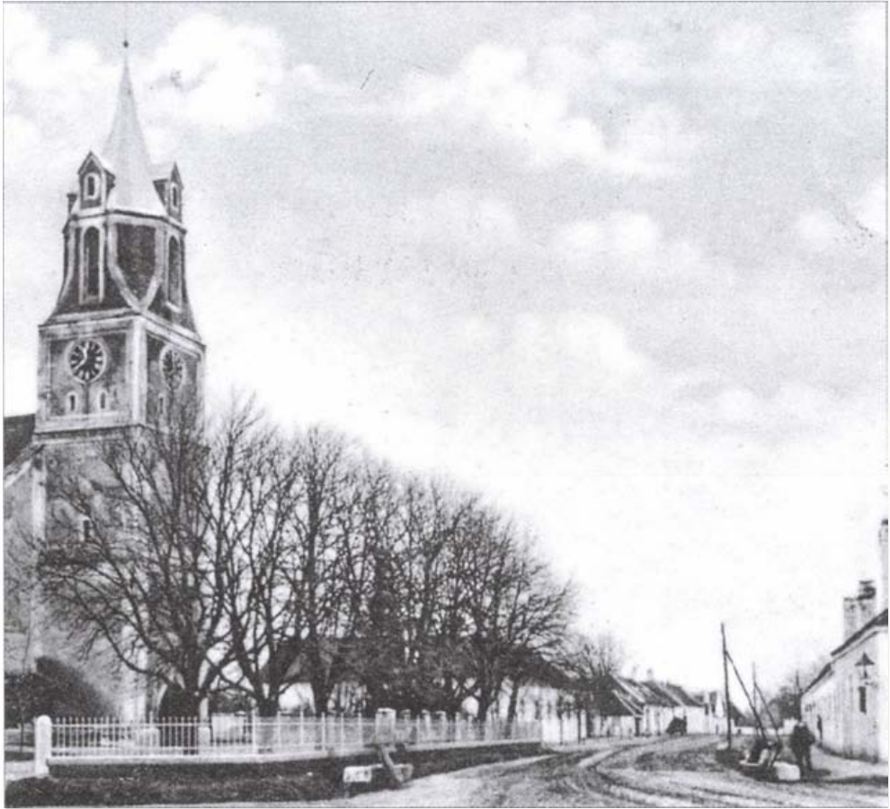
A katolikus templommal szemközt jobbról a második épület a régi egyházi elemi iskola. (A kémények a sarki Városházához tartoznak.) Csepreg, 1901 körül