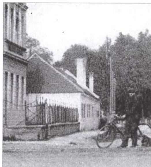
A fehér falú régi iskola dél felől nézve. (Mögötte a kéményes Városháza) 1927