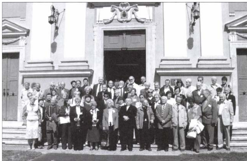
A konferencia résztvevői