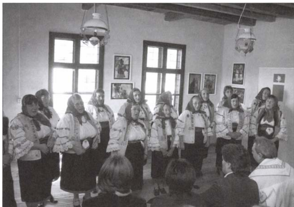
Részlet a tájház megnyitó ünnepségéből

A szobákat úgy rendeztük be és úgy gondoltuk el, hogy nemcsak bejövünk s megnézzük, hanem itt dolgoznak is. Szőnek mind a két szobában, aztán lehet csipkét kötni, varrják a csángó ruhát, amit ki lehet hímezni. Ez a tájház tehát funkcionálisan működik majd, nem úgy, hogy csak megnézzük, mert itt munka is lesz. Az ágyak is úgy vannak megvetve, ahogy szokás nálunk, a csergék is úgy vannak elhelyezve. Még ebben a hónapban elkészül a központi fűtés, két pincénk van, az egyikbe kerül a kazán. A konyhát is úgy képzeltük el, hogy bármikor meg lehet főzni egy puliszkát, egy magyarmálét , 2 lehet pánkót sütni. A régi konyhai eszközök is megvannak: a pityókatörő , 3 a tekerő , 4 a laskadeszka . 5