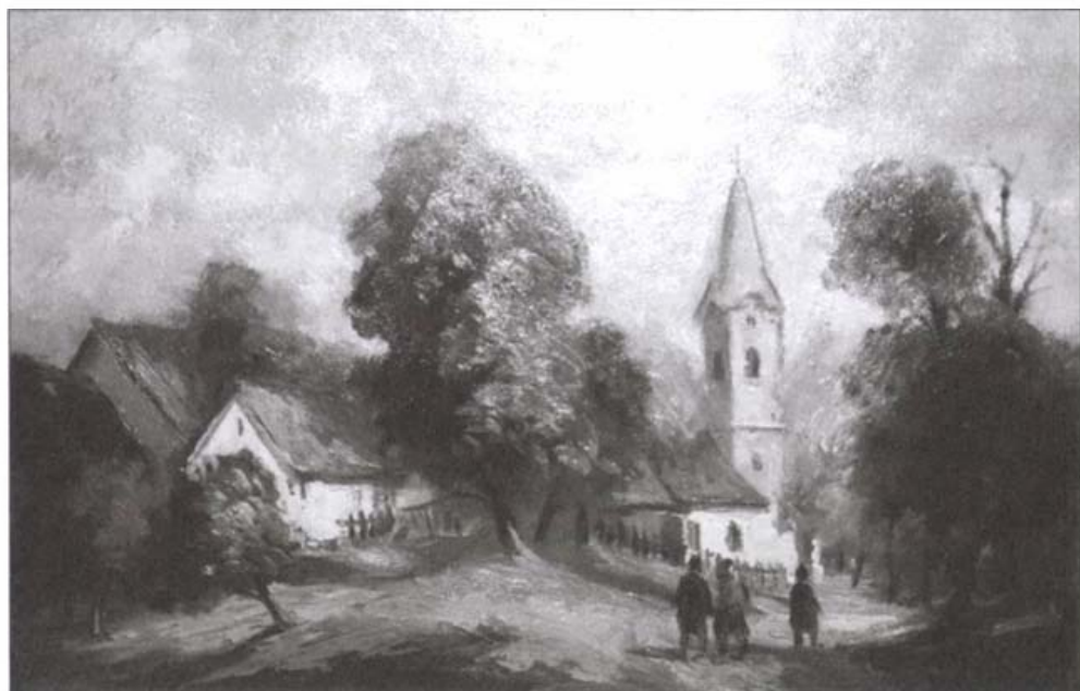
Prudzik József Menschely című festménye

nagyméretű freskóit festette. Emellett jelentős középkori és XVIII–XIX. századi freskókat és táblaképeket restaurált. Munkásságát őrzi a Dunántúl számos temploma: Sopron, Balatonföldvár, Rábasömjén, Mágocs, Pécs, Szekszárd. Itáliától Kanadáig számos magángyűjteményben is megtalálhatók művei.