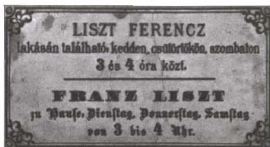
Liszt Ferenc fogadótáblája

A kiállítás rendezője Domokos Zsuzsanna, munkatársai Szabó Ferenc János, Farkas Csilla, Török Miklós és Kirkósa Ádám voltak.