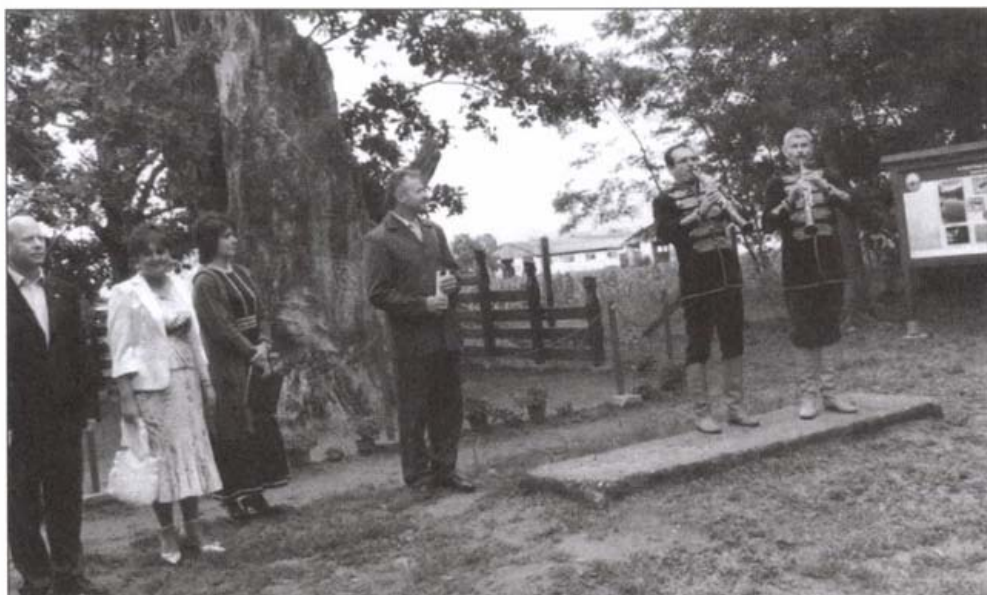
Megemlékezés a Petőfi-fánál

Petőfi Sándor barátja volt. A nagy költő többször járt Magyarban, először 1846-ban, a hagyomány szerint a faluszéli tölgyfa alatt pihent meg, amikor a Luby család vendége volt. Itteni élményei alapján írta meg a Tisza című versét. Az Öreg-Túr Magyar és Kisar között ömlik a Tiszába. A múlt században még a Tisza vizét itták a környező falvak. Közismert a mondóka: „Ki a Tisza vizét issza, vágyik annak szíve vissza”. A környék színmagyar lakosságú: „Kisar, Magyar, Tivadar, ott él a sok jó magyar!”