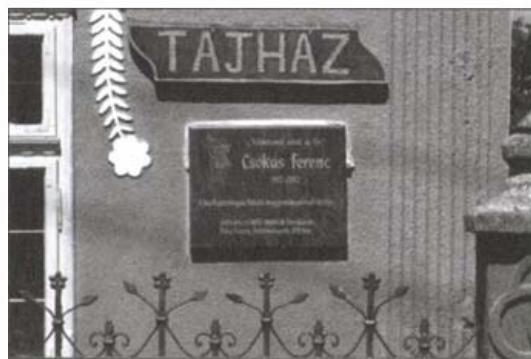
Az emléktábla a tájház falán